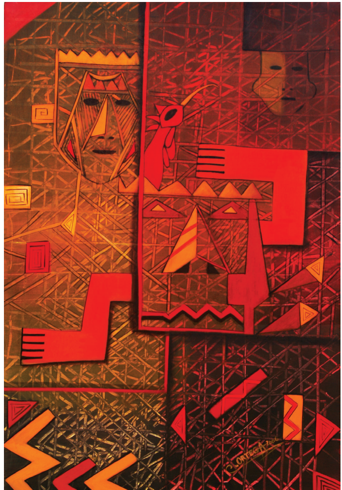
DESDE AQUÍ Óleo sobre tela 84x120

que tendrá como centro el sujeto que aprende, y funcionará de manera flexible y dinámica, incluyente, eficaz y eficiente... integrará una visión intercultural acorde a la diversidad geográfica, cultural y lingüística del país, y el respeto a los derechos de las comunidades, pueblos y nacionalidades (Asamblea Nacional del Ecuador, 2008).