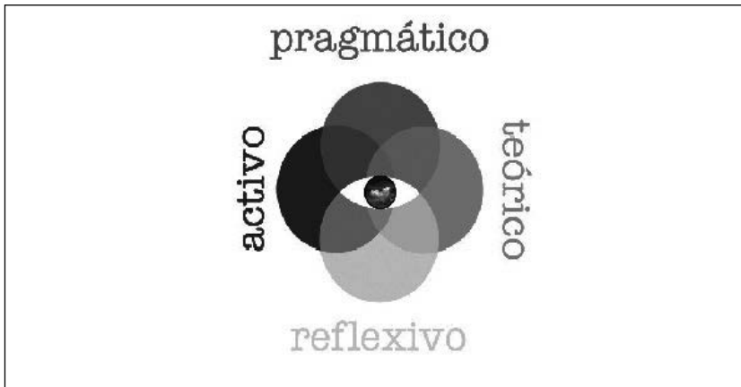
Figura 1. Estilos de aprendizaje según Alonso, Gallego