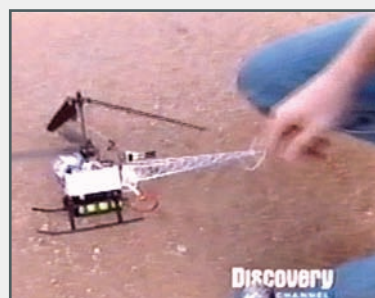
Figura 4.- Prueba secuencial de la efectividad de un PEM. (a) Antena de radiación de pulsos PEM. (b) Helicóptero de pruebas operado control remoto. (c) Helicóptero de pruebas impactado por un pulso PEM radiado por la antena. (d) Helicóptero de pruebas cae inmediatamente al perder su sistema de navegación electrónica.