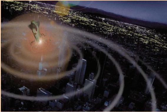
Figura 2.- Propagación de un pulso electromagnético de gran altura. Revista Mecánica Popular 2001