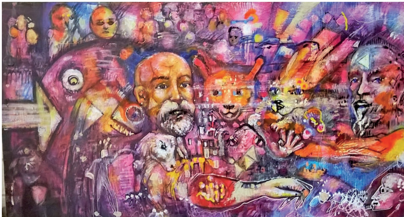
BARCAZA ECUATORIANA Óleo sobre lienzo (2015) 1 x 0,50m

realidad a una gran necesidad de los individuos del grupo humano: la identificación propia y la ajena».