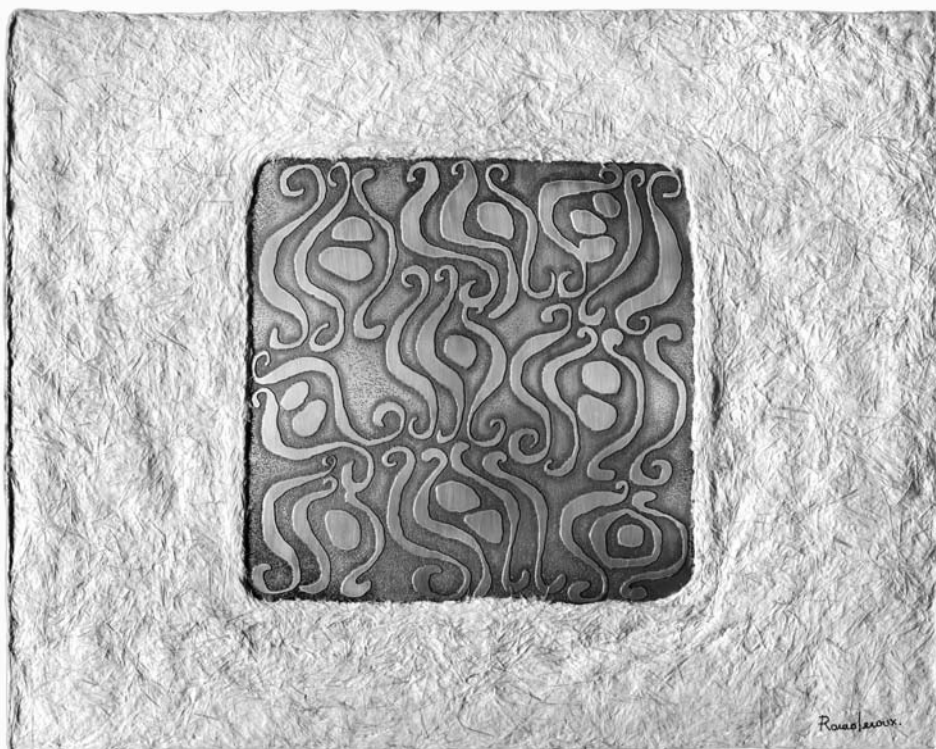
Que respire el aire