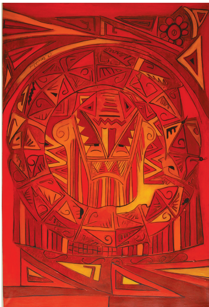
CONEXIÓN Acrílico sobre tela 70X90

Otra diferencia se establece con relación a la definición de la mejor evaluación . La mayoría de los docentes de las EEC delimitan una interesante imagen que no coincide con el concepto que poseen, ni con las prácticas que desarrollan