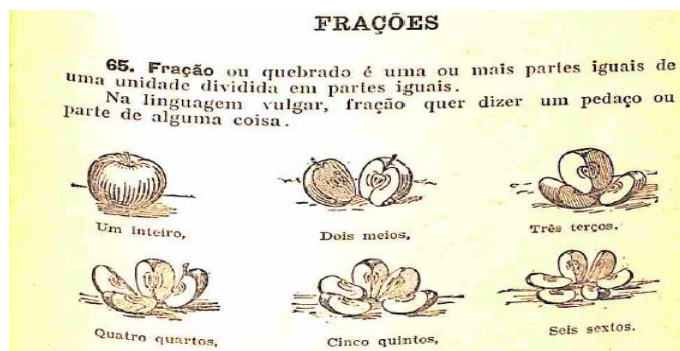
Figura 5: recorte retirado da obra Aritmética Elementar Ilustrada