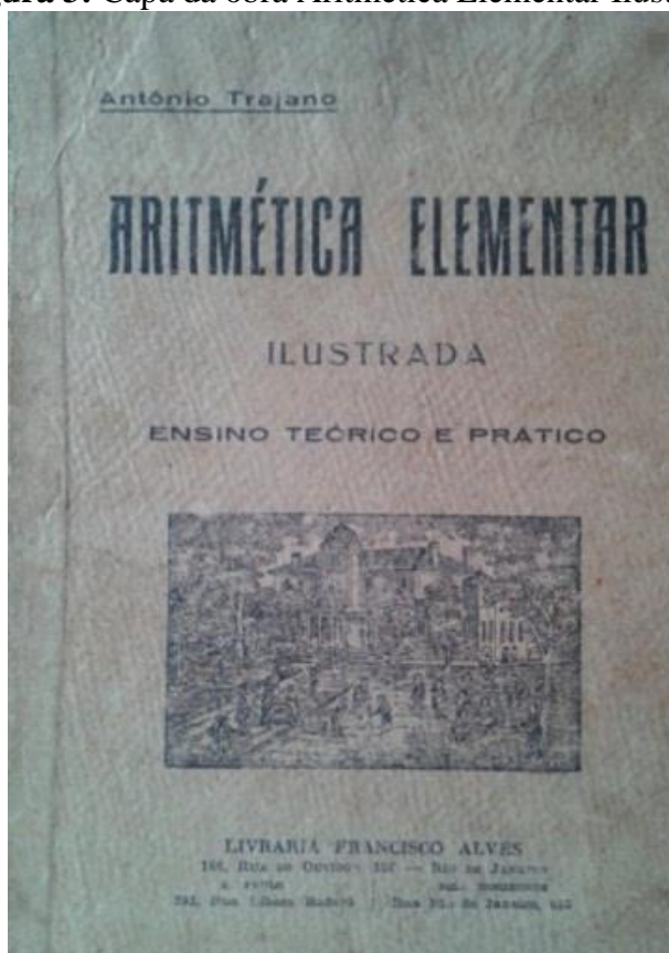
Fonte: Aritmética Elementar Ilustrada , 117ª Edição de 1942.