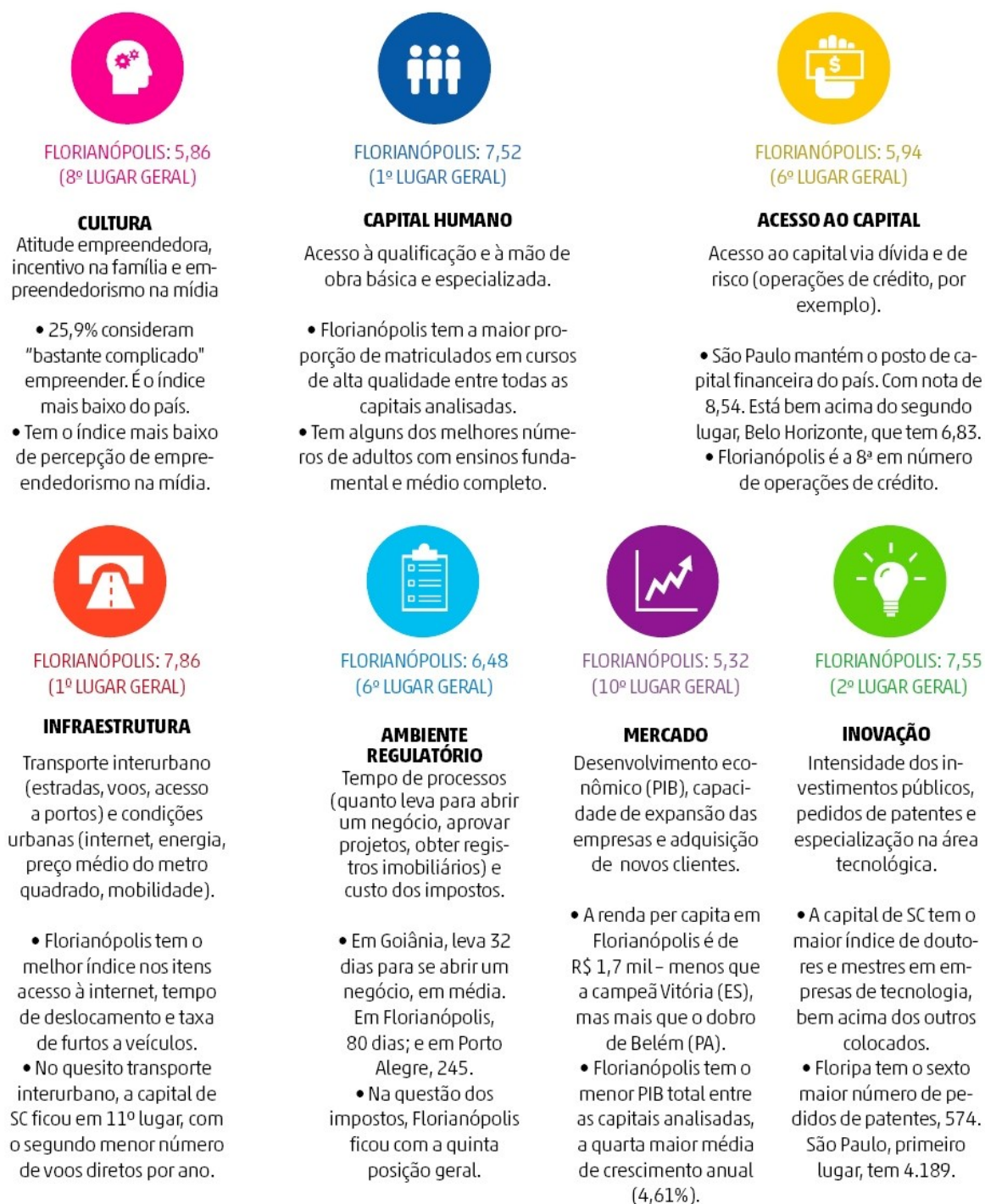
Figura 2: Quadro demonstrativo do significado dos indicadores e a colocação de Florianópolis em 2014.