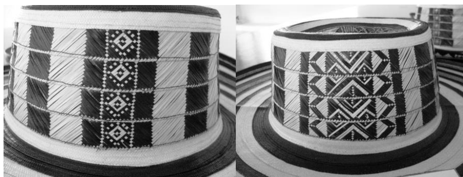
Imagen 3. Encopaduras de sombreros exhibidos durante la Feria del Sombrero Vueltaio en Sampués, 2009.

ellos desconocen el origen o incluso el nombre de las figuras que tejen. En la elaboración del sombrero, tanto quienes tejen, como quienes cosen, prestan mucha atención en que coincidan las pintas de la copa a la perfección.