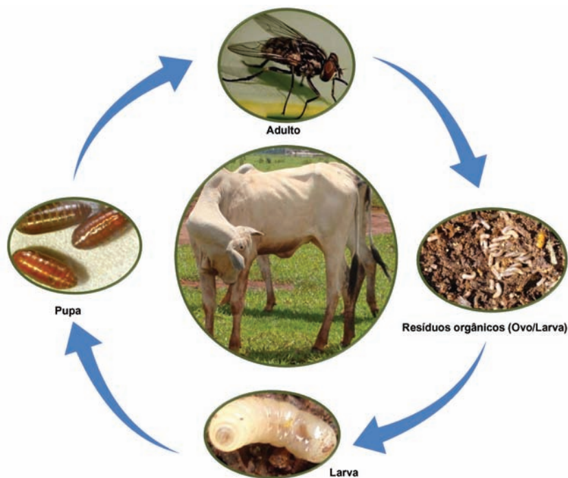
FIGURA 12.1 - Ciclo de vida básico de moscas hematófagas

A mosca-dos-chifres passa quase todo o tempo alimentando-se sobre os bovinos, saindo apenas para colocar seus ovos, que são depositados em fezes frescas de bovinos. Ao contrário da mosca-dos-chifres, a mosca-dos-estábulo passa a maior parte do tempo fora do hospedeiro. Ela só vai até os animais para se alimentar, fica alguns minutos e depois procura um local protegido para repousar. Essa espécie utiliza matéria orgânica preferencialmente em estado de fermentação para se reproduzir (Quadro 12.1).