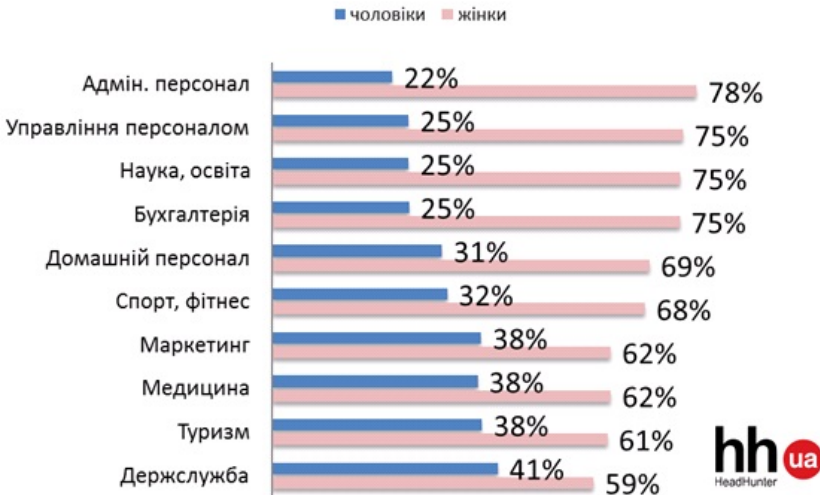
Рис. 3. Топ-10 найбільш «жіночих» професійних сфер

Узагальнюючи можна сказати, що на шляху до встановлення гендерної рівності у нашому суспільстві стоять наступні чинники: