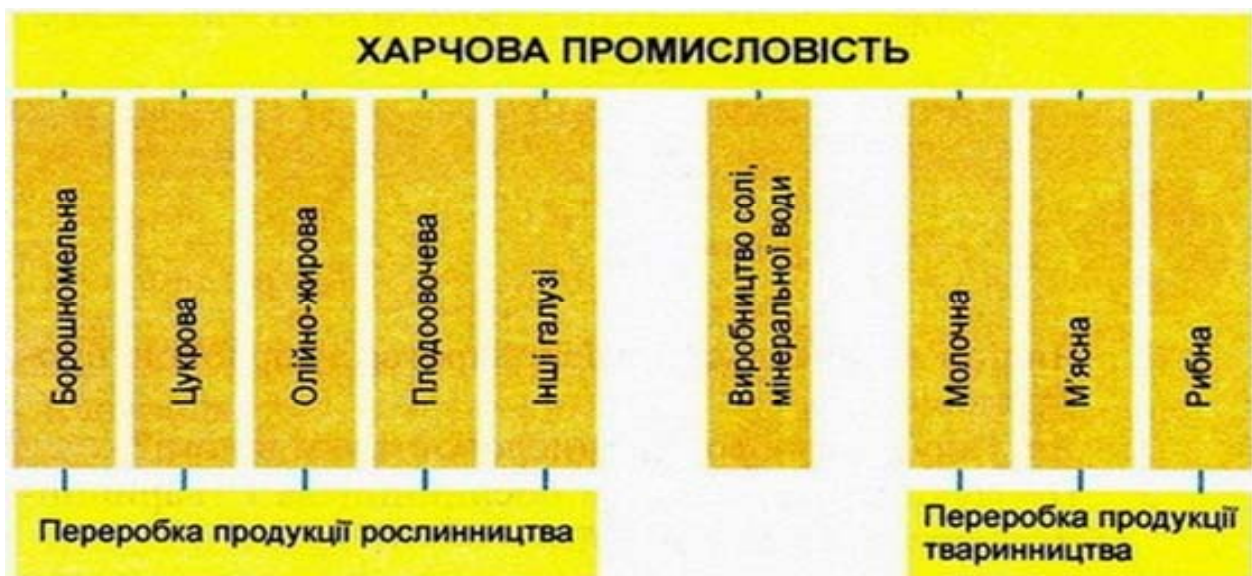
Рис. 1. Галузевий склад харчової промисловості

За результатами проведеного аналізу техніко-економічних показників розвитку харчової промисловості України можна стверджувати, що промисловість потребує: забезпечення реальних заходів з енергоефективності (перехід на альтернативні види палива, заміна обладнання на більш енергоефективне, організація виробництва біопалива, переробка відходів на біогаз, випуск додаткової продукції шляхом забезпечення глибини переробки), гарантування високої якості продукції (удосконалення законодавства, гармонізація стандартів, розробка та