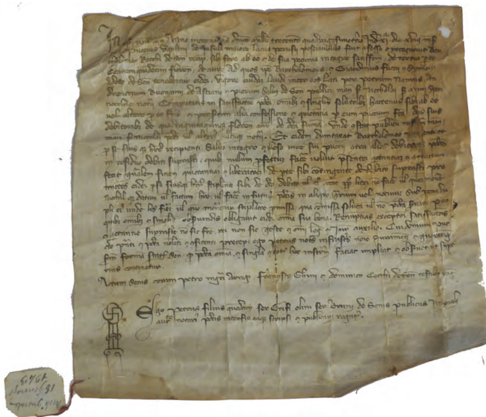
Figura 2. Archivio di Stato di Siena, Diplomatico, Archivio generale , 18 gennaio 1343/4, recto