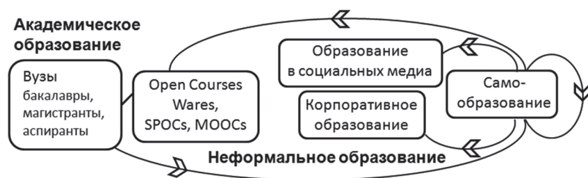
Рис. 2. Совокупность образовательных маршрутов при Life Long Learning

тами в социальных сетях (Facebook и др.), в ТПУ создана студенческая социальная сеть «Flamingo.tpu.ru» для организации межличностного неформального общения студентов, выполнения волонтерских совместных проектов, размещения персональных портфолио.