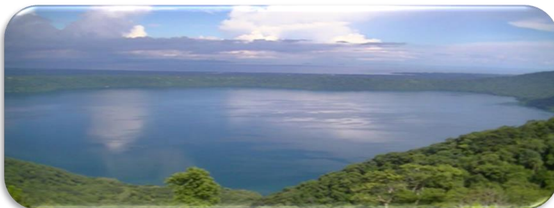
Imagen No.5 Laguna de apoyo, tomada por autores en Nov/2014

Estas, son excelentes destinos Turísticos por el cual es reconocido el Municipio de Catarina, la espectacular Laguna y su excepcional Reserva Natural ilustradas en imagen No.5 poseen las condiciones para desarrollar turismo ecológico; actualmente es conocida como reserva natural, es responsabilidad del MARENA desde el año 1991 y perteneciente al SINAP desde el año 2006. 29