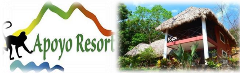
Imagen No.10 Hospedaje Apoyo Resort Nov.2014

Eco Nature Apoyo Resort & Spa está ubicado justo en el centro de la Reserva Natural Laguna de Apoyo ilustración en imagen No.10.