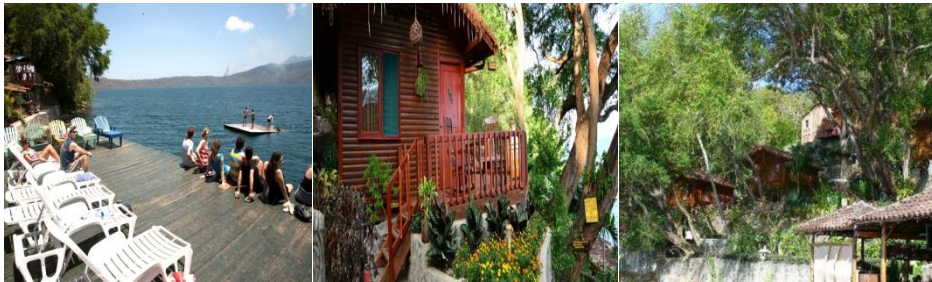
Imagen No.16 hostel posada de LA ABUELA tomada por autores.

A como todos los negocios turísticos alrededor de la laguna de apoyo están debidamente inscritos en la DGI (Dirección General de Ingresos) y realiza el pago de matrícula en la Alcaldía de Catarina. 44