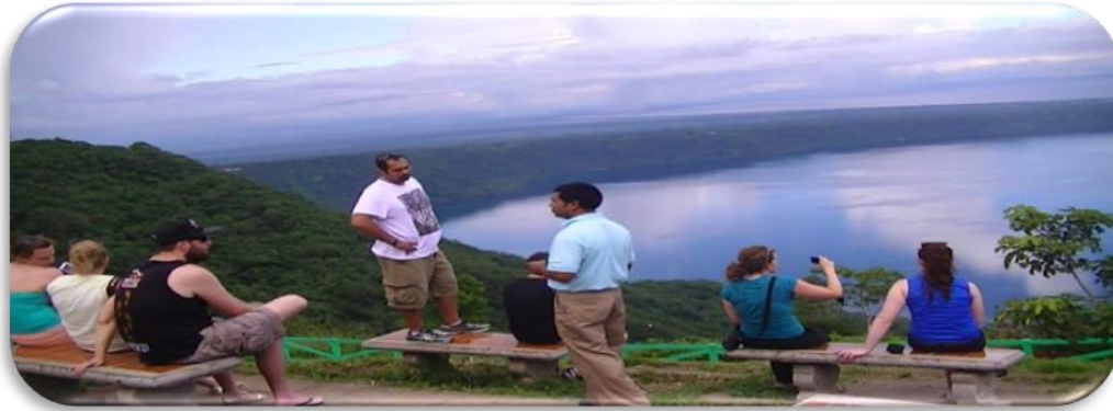
Imagen No4 Afluencia turistas Noviembre 2014

Los ingresos que se perciben en un 70% son destinados para mejoras de dicho centro y el resto se ingresa a la Alcaldía para gastos administrativos y para pequeños proyectos sociales. El mirador tiene una afluencia en 30,000 personas al mes en temporadas normales y con 40,000 personas al mes en temporadas altas las cuales son en semana santa y Diciembre con una división en porcentajes de 60% visitantes Nacionales y 40 % visitantes extranjeros 28 , ilustrados en Imagen No.4 .