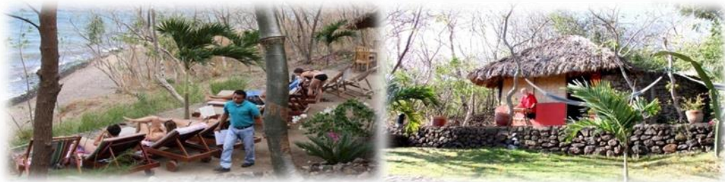
Imagen No.8 Hotel San Simian sitio web Nov.2014

Este impresionante lugar ofrece un espacio para relajarse y disfrutar de la belleza de la Laguna de Apoyo. Con varias cabañas acogedoras, brinda una experiencia muy cercana a la naturaleza, entre otras actividades (renta de kayaks, botes de remo y el velero así como neumáticos flotadores) ilustrado en Imagen No.8 del Documento.