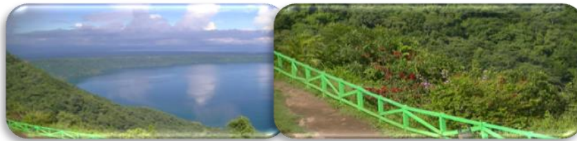
ImagenNo.16 Ilustración representativa de la flora tomada por autores Nov/2014.

A continuación se hace mención de Especies de Flora en peligro a desaparecer en tabla No.3