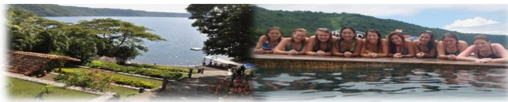
Imagen No.9 Hospedaje The Monkey Hut

Este local deriva su nombre de los monos aulladores que habitan la zona, brinda un ambiente de relajación con vistas panorámicas a esta laguna como se muestra en Imagen No.9.