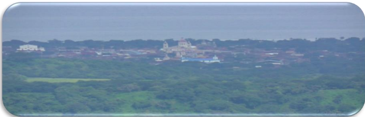
Imagen No.2 tomada por autores Noviembre 2014

Así como el Lago de Nicaragua Cocibolca, incluso rasgos de la ciudad de Granada como se muestra en la imagen No. 2.