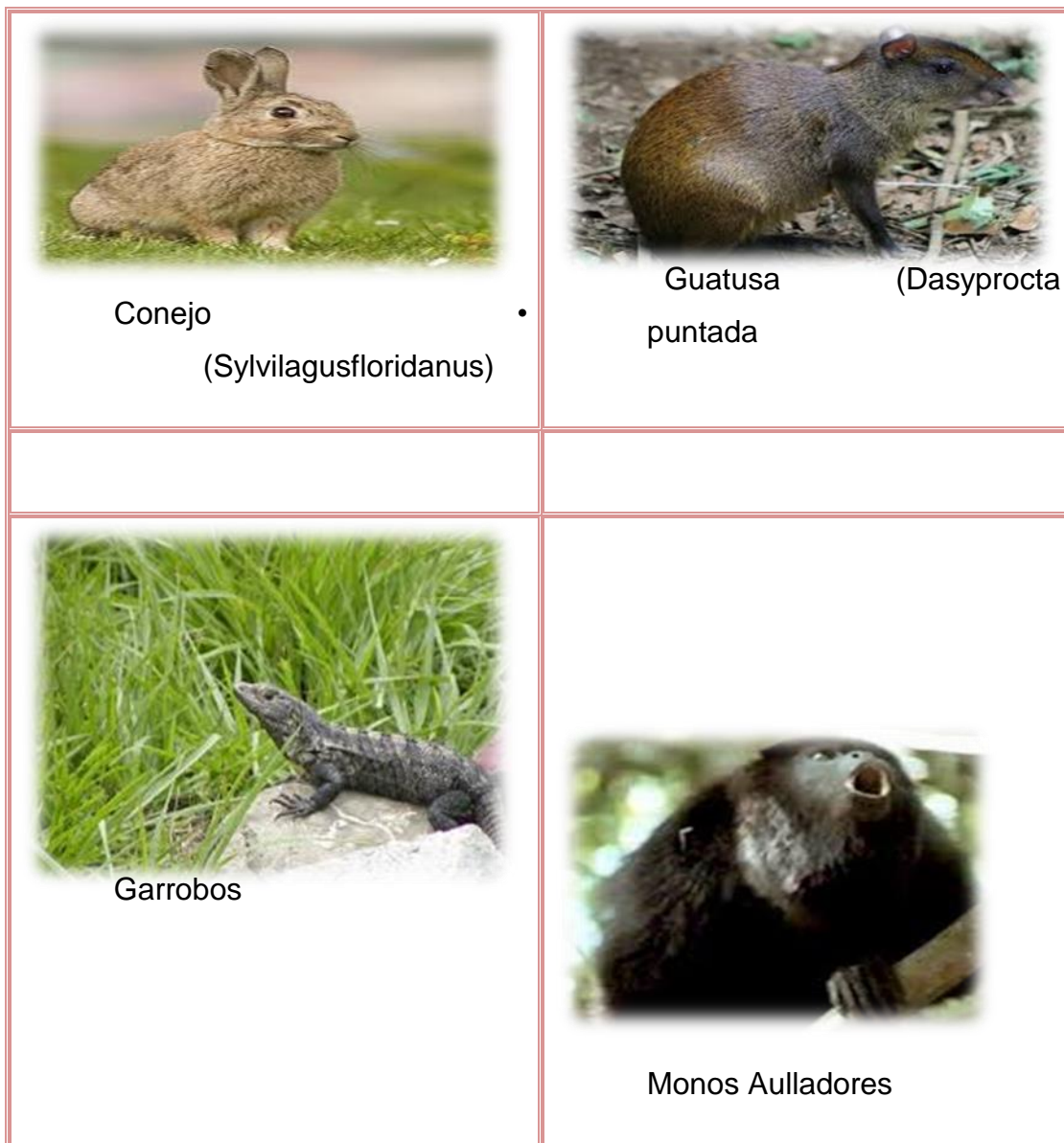
Tabla No.4 Especies de animales del municipio de Catarina en peligro de extinción.