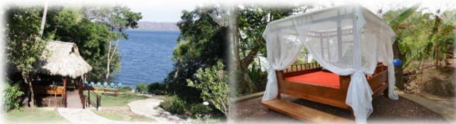
Imagen No.15 Laguna Beach Club tomada de sitio web Nov/2014

Laguna Beach Club en la playa de la Laguna de Apoyo es el punto donde debe empezar una combinación de diversión y descanso. En este local es posible sólo pasar el día por la laguna, pasar también la noche o alimentarse Ilustración en Imagen No.15.