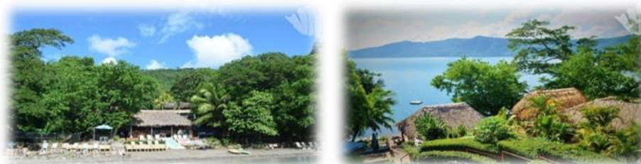
Imagen No.13 Hostal Paradiso tomada de sitio web Nov/2014

Cuenta con un restaurante que también funciona como bar tiene 12 habitaciones, entre las cuales hay cuartos privados y compartidos, equipados con abanico y WiFi gratuito.