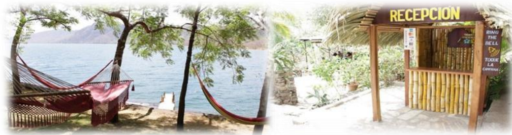
Imagen No.12 Albergue Pájaro Azul tomada del sitio Web Nov/2014

El Albergue Pájaro Azul, ubicado en la costa de la Laguna de Apoyo, abre su amplio local para visitantes que quieran pasar un día u hospedarse y disfrutar de un ambiente natural entre árboles, jardines y animales ilustrados a continuación en Imagen No.12.