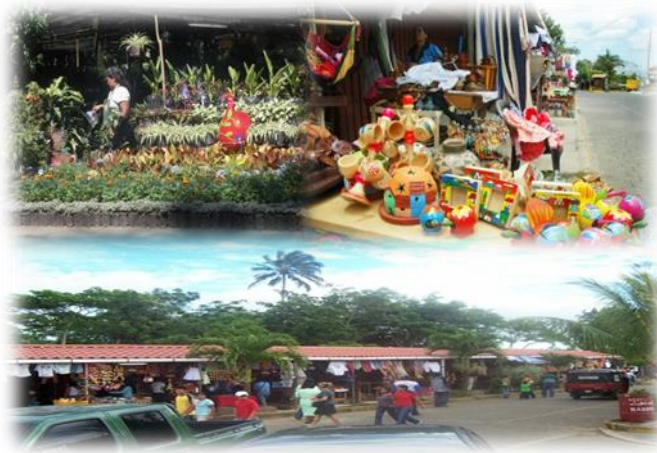
Imagen No.3 Se muestra Comercios en el propio mirador de Catarina tomada por autores en Nov/2014

En la tabla No.2 es posible la apreciación de las cantidades de comercios inscritos según alcaldía municipal de Catarina, de las cuotas en los cuales los Restaurantes la pagan mensualmente, los vendedores ambulantes diariamente, las comiderías y Pizzerías solo pagan matricula más el pago de basura que es mensual estas cuotas 27 son establecidas en proporción a lo que se dedican los comercios en el caso de los puestos de venta de palomitas la cuota mensual es un poco más elevada por lo que ellos ocupan energía eléctrica en estas cuotas ya va incluido el cobro de basura por el mantenimiento de limpieza del mirador de Catarina ilustrado en imagen No.3.