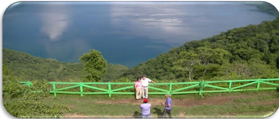
ImagenNo.1 Noviembre del 2014

La belleza de Catarina está en sus paisajes el mirador es un sitio perfecto y agradable ubicado a 45 kilómetros de Managua, y seis de Masaya, La vista es espectacular, desde este se puede apreciar toda la laguna de apoyo mostrada en imagen No.1.