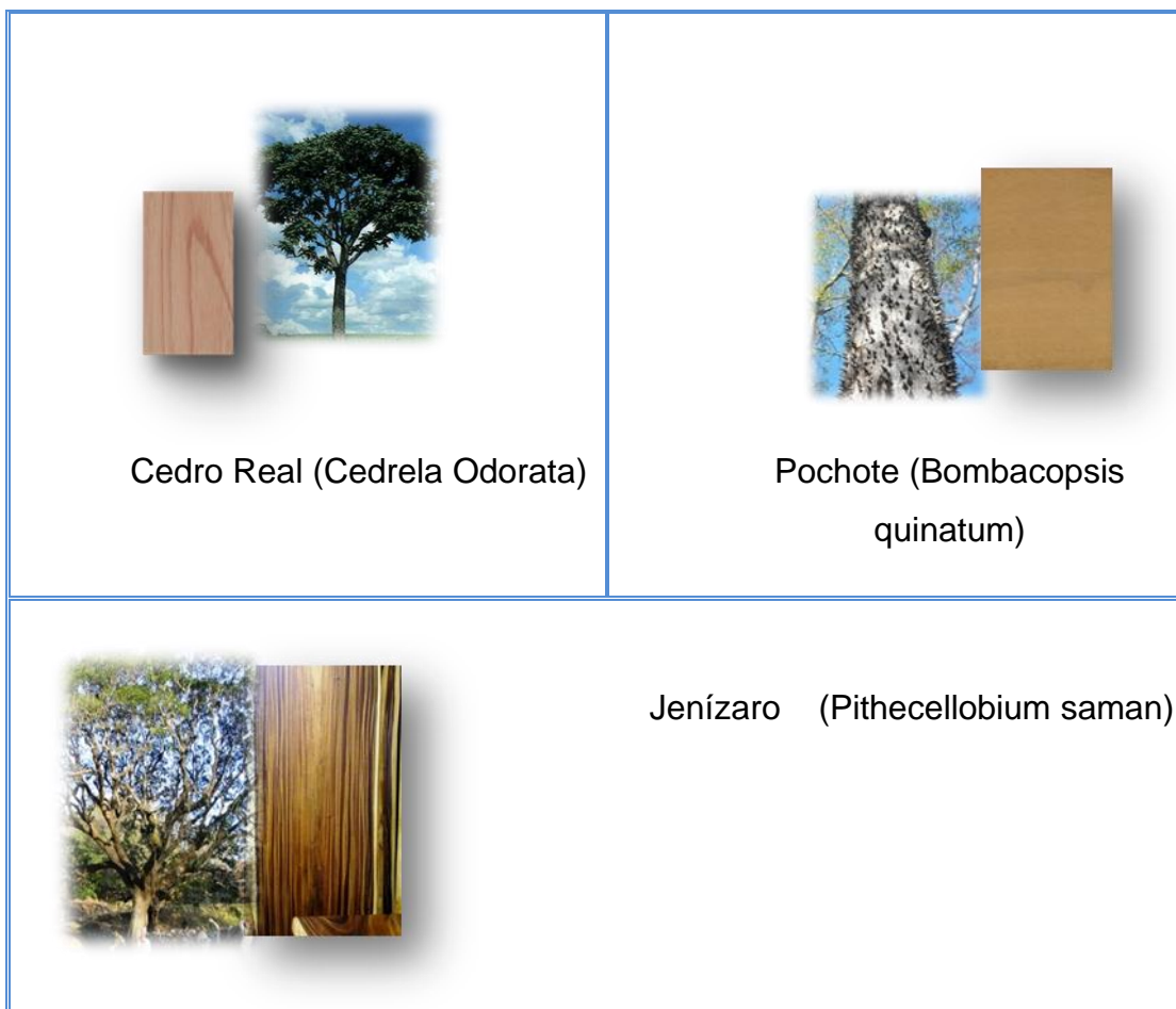
Tabla No.3 Flora en peligro de extinción del municipio de Catarina: