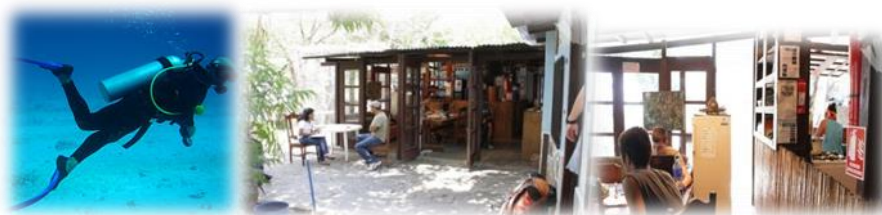
Imagen No.11 Albergue estación biológica tomado sitio web Nov/2014

Además de disfrutar de la Laguna de Apoyo, la Estación Biológica ofrece cursos de español, tours y observación de aves y plantas en bosque seco. También se puede practicar scubadiving o alquilar kayak mostrado en ilustración de imagen No.11