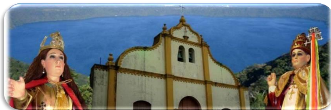
Imagen No 17 Ilustración de Santos patrono del municipio de Catarina e iglesia tomada de sitio web Nov/2014

A continuación mostremos en Imagen No.17 Ilustración de los santos patronos del municipio de Catarina: