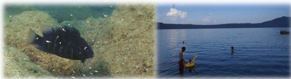
Imagen No.7 Aguas de Laguna de Apoyo sitio web Nov.2014

La Reserva Natural Laguna de Apoyo posee la laguna cráterica más extensa y con las aguas más cristalinas en toda Nicaragua, rodeada por uno de los únicos remanentes de bosque latifoliado en el pacífico de Nicaragua, es una de las mejores y más imponentes vistas escénicas naturales que se pueden conseguir en el país representado en imagen No.7