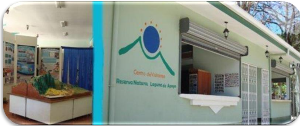
Imagen No.6 Centro de visitantes de la reserva tomada del sitio web Nov.2014

Además, brinda la oportunidad de organizar excursiones y visitas a la Laguna de Apoyo a través de sus senderos naturales, para conocer de primera mano la fauna, flora, geología y cultura de la zona, A través de sus dinámicas salas de exposición y video, niños y adultos aprenden sobre los elementos naturales y humanos de la reserva, y se enteran de la importancia de conservarla le mostramos la fachada principal del centro en imagen No.6.