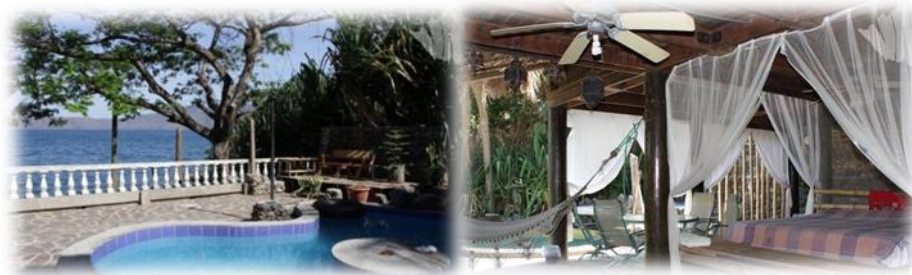
Imagen No.14 Hotel Selva Azul tomada de sitio web Nov/2014

El Hotel SelvAzul también ubicado en la playa de la Laguna de Apoyo, tiene un ambiente tropical multicultural, en el equilibrio entre amigable con el medio ambiente y cómodo ilustrado en imagen No.14.