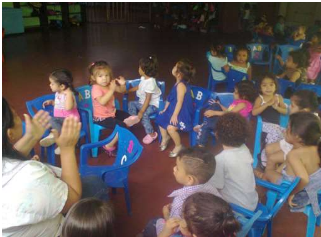
Educadora entonando canto a los niños y niñas

Validez de la información: Se comprobó mediante las técnicas utilizadas para verificar que la información analizada estaba relacionada con el foco de estudio, las cuestiones y los propósitos de investigación.