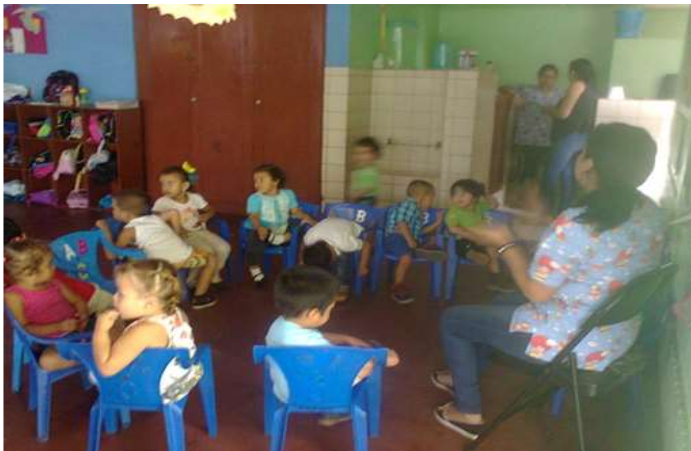
Educadora entonando cantos a los niños

“La Política Nacional de Atención y Protección Integral a los derechos de las niñas, niños y adolescentes es de naturaleza pública y se formulará y ejecutará a través de un Consejo Multisectorial establecido por el Estado, de responsabilidad compartida del gobierno y las distintas expresiones de la sociedad civil organizada, y la participación activa de las familias, las escuelas, las comunidades y las niñas, niños y adolescentes.”