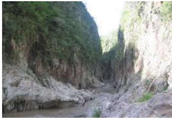
El Cañón de Somoto.