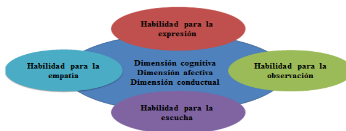
Figura N° 4. Dimensiones del proceso de formación de las habilidades para la comunicación profesional de enfermería.

La figura N° 4 ilustra las ideas planteadas: