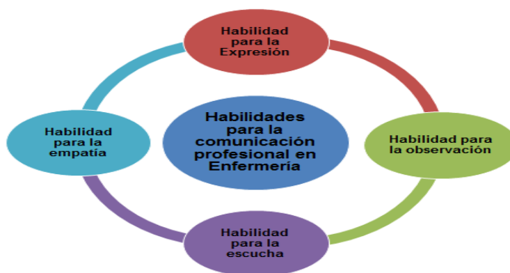
Figura N° 2. Habilidades para la comunicación profesional de enfermería

Para el desarrollo de estas acciones profesionales que tienen lugar en los diferentes contextos laborales es indispensable la formación y desarrollo de un grupo de habilidades comunicativas que se corresponden con los tipos de comunicación antes descritos tales como, la habilidades para la expresión, la observación, la escucha y la empatía que la autora conceptualiza en el capítulo anterior como habilidades para la comunicación profesional , representadas en la (Figura N° 2) y abordadas por diferentes autores cubanos a los que se hace referencia a continuación.