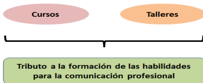
Figura N° 5. Formas de organización docente para la formación habilidades para la comunicación profesional de enfermería.