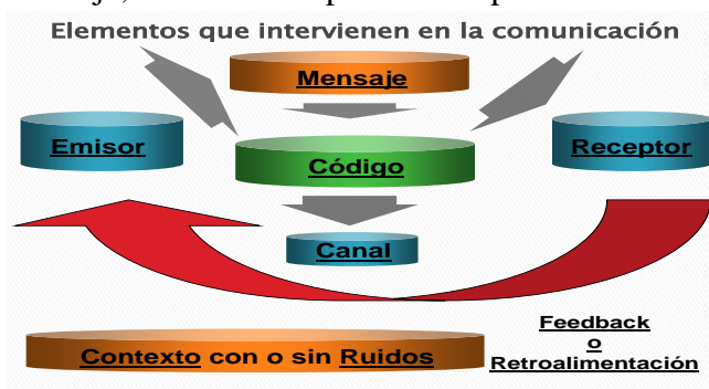
Figura N° 1. Elementos que intervienen en la comunicación

Como se ilustra en la figura # 1, entre los elementos que pueden distinguirse en el proceso comunicativo, se encuentra el contexto que puede o no tener la presencia de ruidos, el código (un sistema de signos y reglas que se combinan con la intención de dar a conocer algo), el canal (el medio físico a través del cual se transmite la información), el emisor (quien desea enviar el mensaje) y el receptor (a quien va dirigido), en la figura se muestra el Feedback o retroalimentación del mensaje, donde el receptor se comportaría como emisor y viceversa.