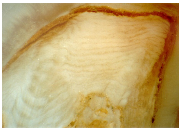
Slika 1: Vzdolžni prerez prvega meljaka ( M_1 ) jelenjadi (levo) omogoča razmeroma enostavno določanje starosti živali s štetjem letnih prirastnih plasti zobnega cementa, ki se ciklično nalagajo med obema koreninama oziroma ob njih (puščici), in sicer kot izmenične temne (zimske) in svetle (poletne) plasti (desno – pogled pod lupo).