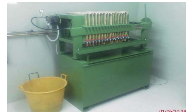
Ploščati tlačni filter

Filtrirano olje se steka v oljnem rezervoarju in se občasno, ko se nivo dvigne, prek črpalke prečrpa v glavne rezervoarje za skladiščenje olja prostornine 2 x 10 m 3 . Oljna pogača brez olja iz druge faze stiskanja se termično obdela v 5 m dolgi tunelski peči (transporter s tunelskim ogrevanjem pogače). Termično obdelano pogačo lahko uporabljamo kot visoko vredno živinsko krmo. Je alternativa uveljavljenim močnim krmilom, ki prihajajo v glavnem iz uvoza.