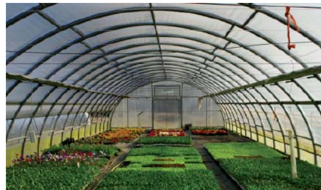
Rastlinjak v podjetju Gozdno gospodarstvo Novo mesto

Danes je glavna dejavnost podjetja izvajanje koncesije v državnih gozdovih. Za potrebe koncesije in na trgu izvajajo sečnjo in spravilo gozdnih sortimentov, izdelavo in vzdrževanje vlak ter gozdnogojitvena in varstvena dela. Poleg drugih stranskih in pomožnih dejavnosti se ukvarjajo tudi s predelavo lesa ter proizvodnjo in prodajo vrtnarskih proizvodov. Ravno raba lesne biomase za potrebe vrtnarske proizvodnje je vzrok, da predstavljamo GG Novo mesto, kot primer dobre prakse.