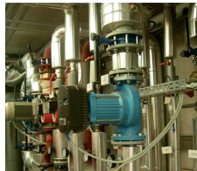
Sistem vodnih črpalk

Proizvodnja toplote v kotlovnici poteka sezonsko. V kotlovnici so nameščeni dodatni hranilniki toplote kapacitete 30.000 l. Namen hranilnikov je optimiranje delovanja kotla ter rezerva ob morebitnem izpadu.