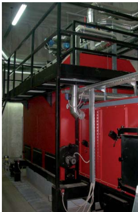
Kotel na lesne sekance

Z dovajanjem primarnega zraka pod rešetke se pospešuje zgorevanje lesne mase. Deloma nepopolno zgoreli lesni plin, se vodi skozi plamenico kjer se krožno dodaja sekundarni zrak. Z dovajanjem primarnega in sekundarnega zraka se doseže vrtničenje plamena in popolno zgorevanje. Rešetka vzdržuje zadostno žerjavico, kar omogoča, da je naprava tudi do nekaj ur v stanju mirovanja. Kurišče z oznako TR-B N omogoča uporabo goriva z visoko vsebnostjo vode. Konstrukcija kurišča je izdelana iz cevi v kletkasti izvedbi in obložena s šamotom in izolacijo.