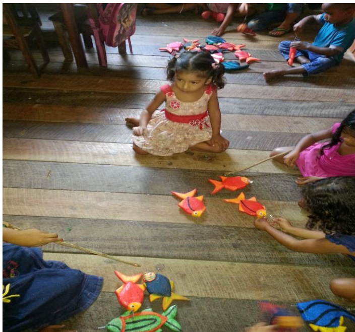
Figura 8 - Lado direito da sala de aula onde as crianças ouvem histórias e brincam.