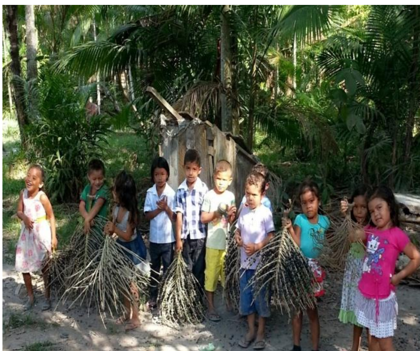
Figura 23 - Noção de pesado utilizando cachos de açaí na balança

As crianças estavam ansiosas na situação sobre medida de massa. Enquanto algumas iam trazendo os cachos, as outras observavam de perto a pesagem. Desse modo, iam conferindo o peso de cada um dos cachos que estavam sendo pesados. Quando foi comunicado que haviam acertado os pesos dos cachos de açaí na ordem em que foram dispostos, as crianças começaram a pular de alegria. O registro da situação de aprendizagem pode ser visualizado na Figura 23.