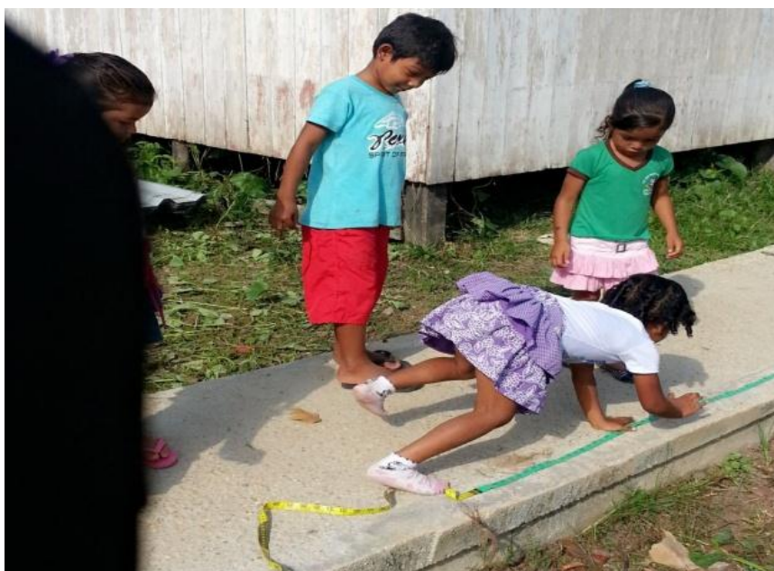
Figura 19 - Medida da altura da árvore por meio de braçadas

A análise da ideia 2 do quadro 4 sobre como medir a altura da árvore apresentou-se como solução de que se poderia medir com a mão. Em um primeiro momento, fiz conjecturas de que as crianças iriam medir por meio de palmos. Todavia, a criança que trouxe a contribuição mediu o comprimento da altura da árvore em forma de braçadas. A criança mediu a altura da árvore com 20 braçadas. A segunda criança que participou dessa situação de aprendizagem mediu a altura da árvore com 14 braçadas. Essa forma de medir não atraiu a atenção das crianças. Elas não queriam participar, pois exigia muito esforço de seus braços. Então, nessa situação de aprendizagem, houve apenas duas meninas realizando a medida da altura da árvore com as mãos em forma de braçada. A situação pode ser visualizada na Figura 19.