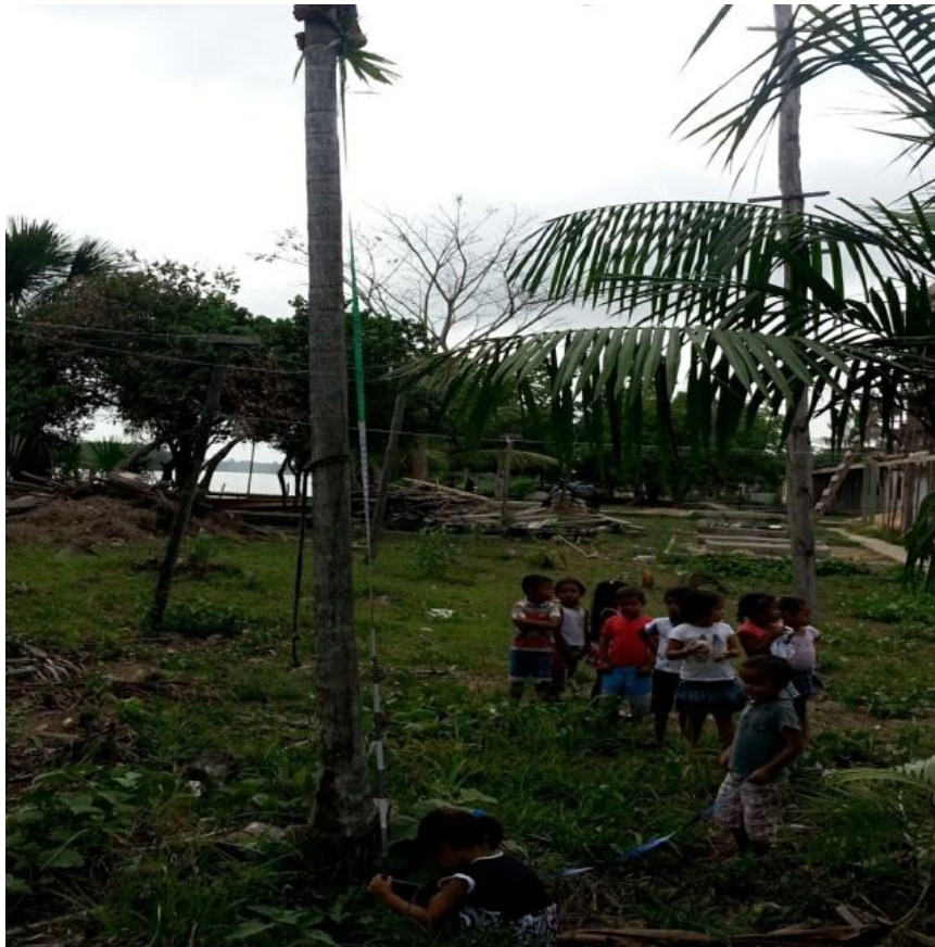
Figura 14 - Medida da altura da árvore com fita métrica

As crianças assinalaram na fita a altura da árvore com pincel atômico. No local marcado com pincel sobre a altura da árvore, as crianças resolveram enrolar o resto da quarta fita e amarrar. Assim, ficou bem definido na fita métrica o que correspondia à altura da árvore. O registro da atividade pode ser visualizado na Figura 14.