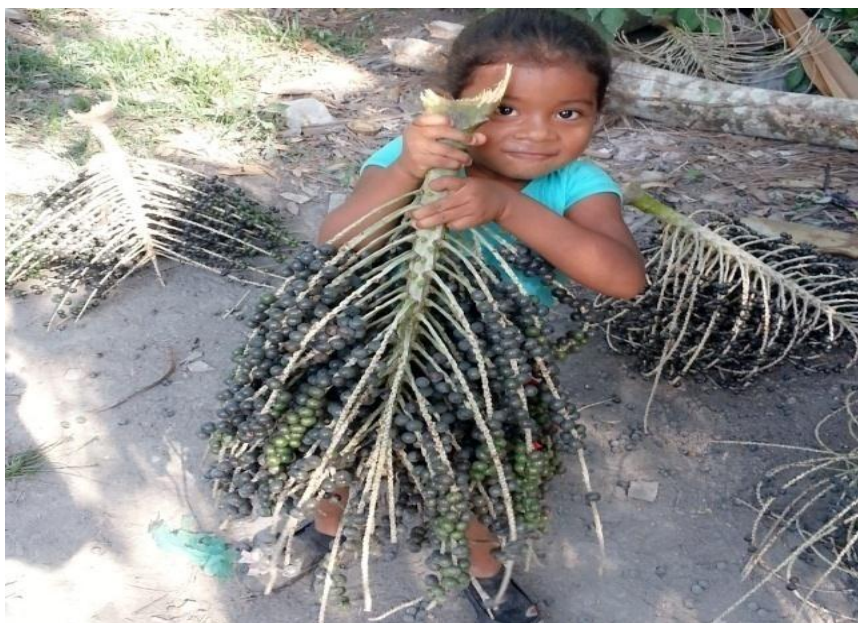
Figura 22 - Noção de pesado por meio de carregar cachos de açaí