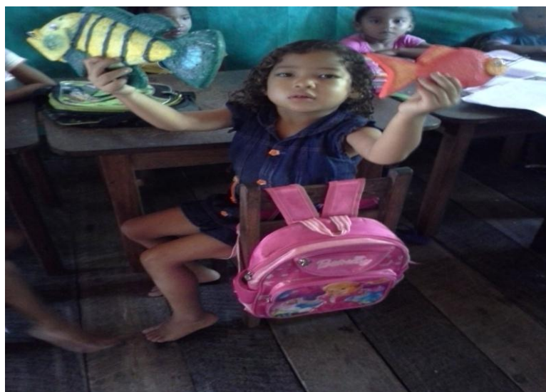
Figura 7 - Lado esquerdo da sala onde ficam sentadas as crianças

As crianças sentam em um banco que não pode ser removido por estar preso na parede. Ao sentarem nesse banco, as crianças ficam com as costas para a parede, que possui um TNT verde onde são afixados os trabalhos produzidos. Do outro lado das mesas, as crianças ficam sentadas em cadeiras, como se pode visualizar na figura 7.