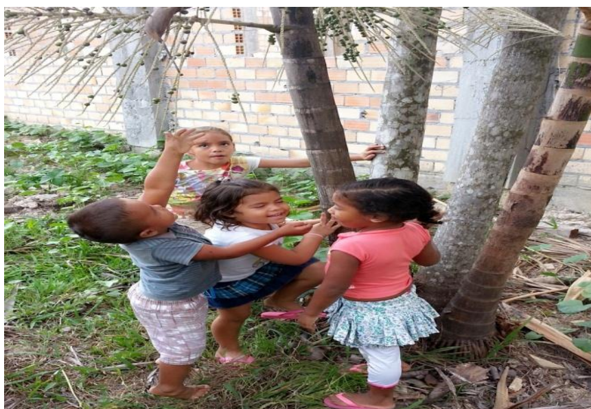
Figura 13 - Na noção de altura: o que posso tocar é baixo

Nesse instante confirmei como uma das primeiras impressões a forma como as crianças concebem a noção de altura. Para esse grupo de crianças, qualquer coisa que esteja acima da pessoa, mas que ela possa tocar com as mãos, não é alto, mas baixo. Logo, ao tocar com a mão o cacho de açaí, essa árvore se torna baixa em relação à pessoa. Esta conclusão pode ser percebida quando uma das crianças, ficando na ponta do pé e se esticando toda até conseguir tocar o cacho de açaí, falou: Professor, esta árvore é bem baixa . A situação pode ser visualizada na Figura 13.