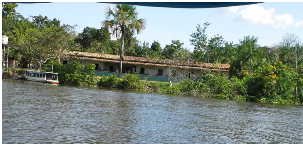
Figura 2 - Fachada completa da escola onde se realizou a pesquisa

Na Figura 2, apresento uma fotografia da escola para identificar o que está ao seu redor. Do lado esquerdo de quem está olhando, percebe-se apenas a caixa d'água do posto médico, que está desativado. Atrás da escola, há a floresta amazônica; à sua frente, o rio Moju. Do lado direito da escola, há uma residência, que está escondida pelas árvores, mas é possível perceber muitas árvores de açaí que formam o açazal desta residência.