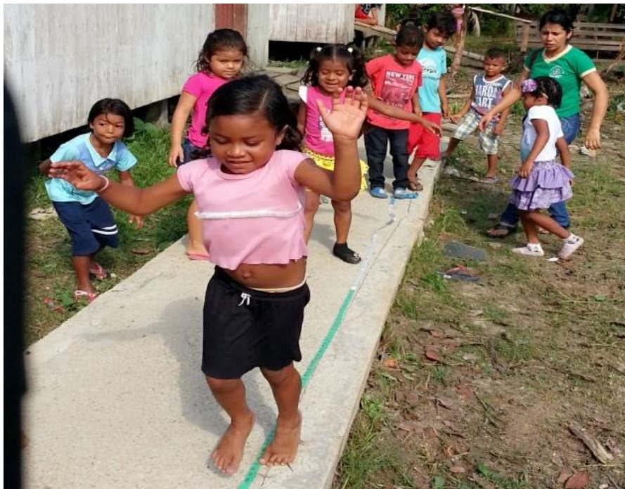
Figura 20 - Medida do comprimento da altura da árvore por meio de pulos

Por comparação as crianças puderam perceber que dependendo do tamanho do pulo o comprimento da altura da árvore poderia ser feito por menos ou por mais pulos. De acordo com Paulina (2011), medir é eleger uma unidade que pode ser medida, não convencional, como pés, palmos, pulos, etc. e determinar quantas vezes ela cabe no objeto a ser medido. Ao comparar a quantidade de pulos das duas crianças, evidencia-se que o comprimento da altura da árvore coube em sete pulos grandes de uma das crianças e coube em dezoitos pulinhos de outra. A quantidade de pulos está diretamente relacionada ao tamanho do pulo de cada criança.