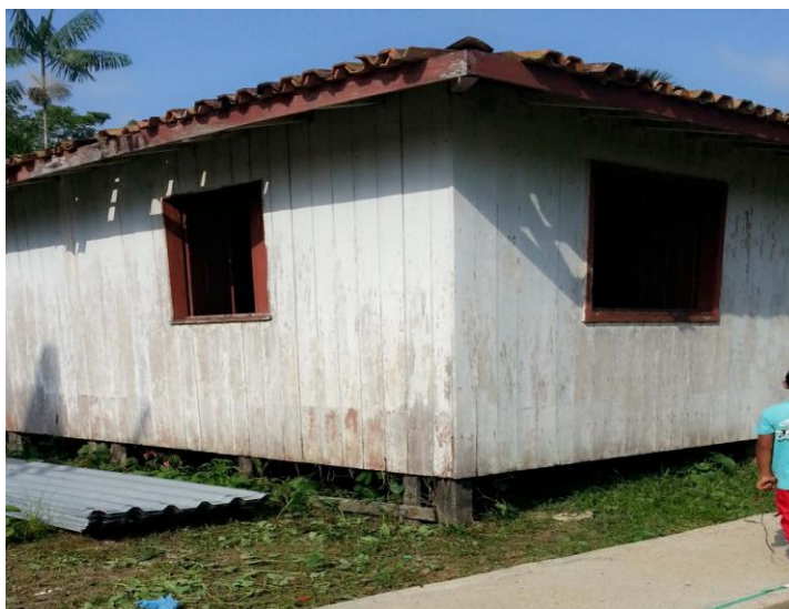
Figura 3 - Fachada do prédio anexo da escola onde se realizou a pesquisa