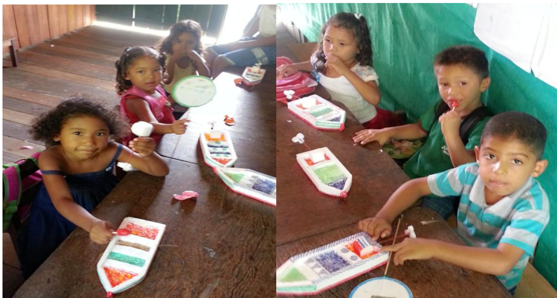
Figura 6 - Visualização completa da sala de aula