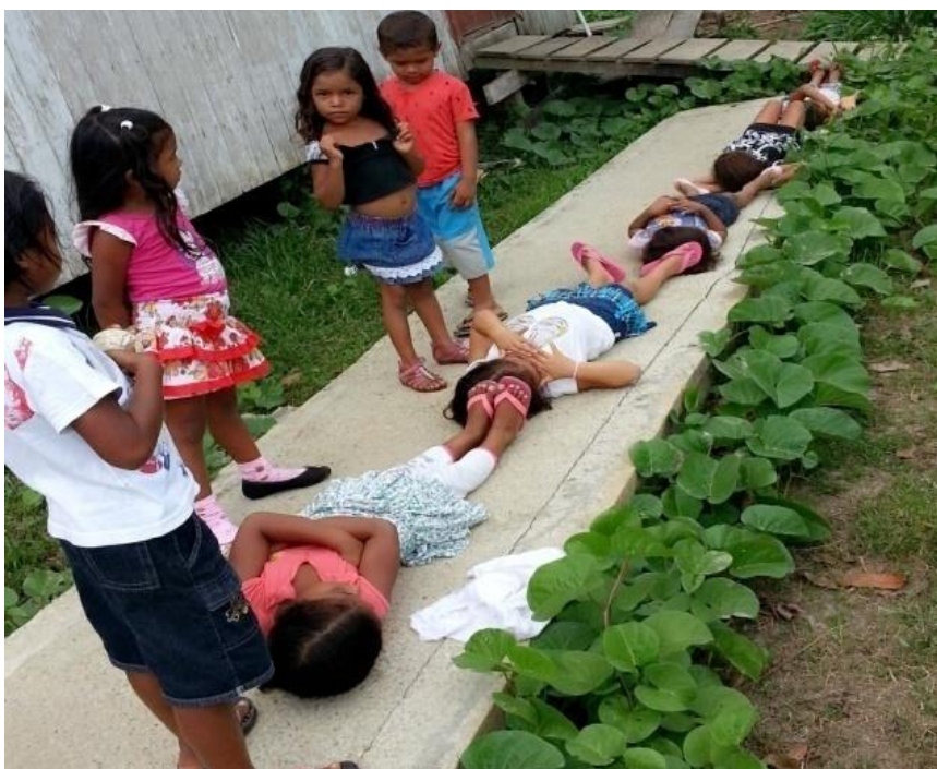
Figura 15 - Medida da altura da árvore utilizando a altura das crianças

Na análise da situação dada, percebe-se que a estratégia utilizada pelas crianças de esticar a fita e ir colocando as crianças deitadas uma a uma com o pé esbarrando na cabeça da outra foi uma excelente ideia. Assim, constataram que cinco crianças correspondiam ao tamanho da altura da árvore de açaí, e até passava um pouquinho. O que possibilitou esse entendimento de estimativa foi que a medida do comprimento da altura da árvore ficava logo acima da orelha da quinta criança. Essa constatação das crianças permitiu concluir que a altura da árvore era equivalente à altura das cinco crianças utilizadas na situação proposta. O registro feito pode ser visualizado na Figura 15.