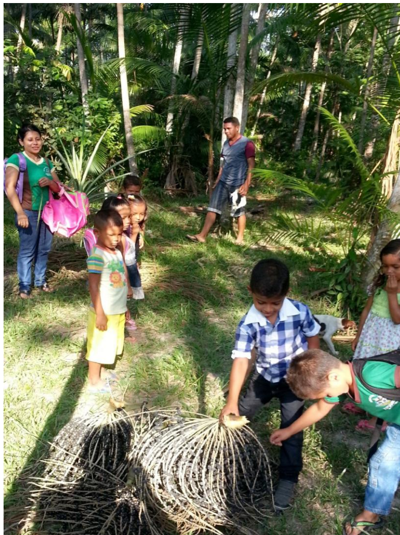
Figura 21 - O pai de uma das crianças apanhado ou coletando cachos de açai.

Para realização dessa situação de aprendizagem sobre Medida de massa (pesado), contou-se com a participação de um pai. Esta foi a pessoa que auxiliou subindo nas árvores de açai para apanhar ou coletar os cachos. As crianças auxiliaram recebendo os cachos assim que eram apanhados. Foram apanhados ou coletados oito cachos de açai, que foram dispostos em um único local, todos juntos, formando um monte. A seguir, na Figura 21, podemos visualizar o pai que auxiliou nessa situação de aprendizagem.