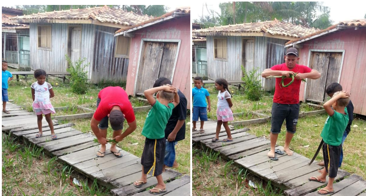
Figura 10 - Construção de uma peconha com folha da árvore do açazeiro.

construção da peconha 7 para que o garoto subisse na árvore a fim de medir a altura desta. A seguir, na Figura 10, podemos visualizar o pai que auxiliou na situação de aprendizagem.