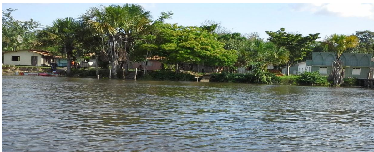
Figura 4 - Panorama da vila onde se localiza a escola em que se realizou a pesquisa

A casa paroquial, como anexo da escola, encontra-se ao lado da igreja, que, junto com mais cinco casas, formam a quantidade de residências da vila. Na Figura 4, do lado esquerdo de quem está olhando, fica visível a casa que está mais próxima da escola e que, na fotografia da escola, acabava ficando camuflada por entre as árvores. Em seguida temos mais uma residência familiar, a casa dos professores, mais uma casa de família e o salão paroquial, que funciona como anexo da escola. À direita do salão paroquial está a igreja. Bem à direita da igreja, sem visualização na foto, fica a residência do pastor. A figura 4 apresenta os arredores do anexo da vila onde a pesquisa foi realizada.