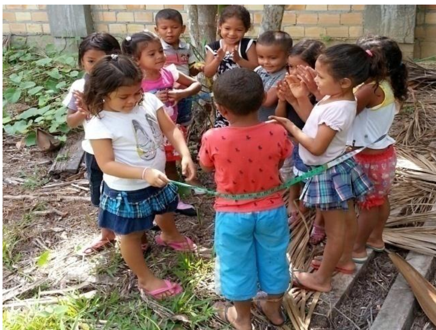
Figura 16- Medida da altura utilizando as crianças dispostas em forma circular

A análise da ideia 1 de passar a fita em torno das crianças com estas dispostas lado a lado em forma circular não se apresentou favorável. As crianças não conseguiam ficar juntas lado a lado formando uma roda com seus corpos. Elas sempre se mexiam e se afastavam um pouco das outras, e acabava por ficar espaço entre elas. No entanto, concluíram que seriam necessárias dez crianças para realizar a atividade utilizando a largura de seus corpos. Esta situação pode ser visualizada na Figura 16.