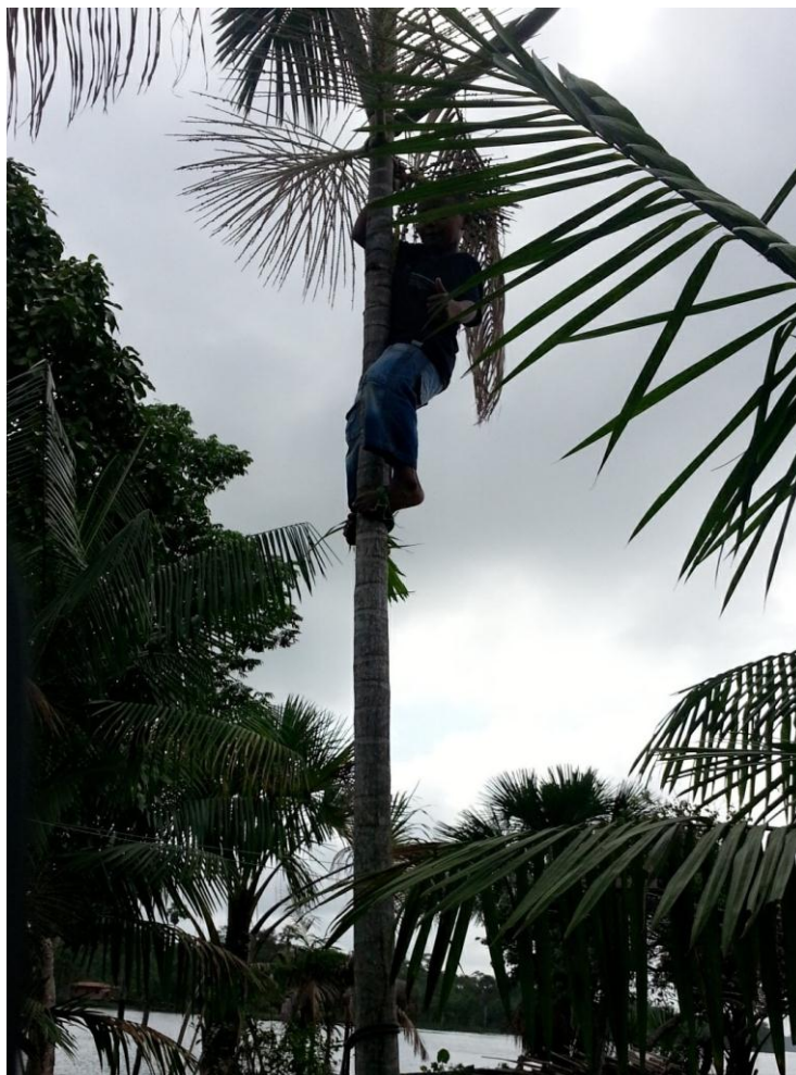
Figura 11 - Garoto subindo no alto da árvore de açaí

(cinco metros). Entretanto, neste primeiro momento a ser visualizado, o garoto apenas está subindo na árvore.