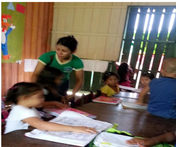
Figura 5 - Visualização da sala de aula em uma situação de aprendizagem.

A sala de aula é pequena, com 6m de largura por 2,5m de comprimento. Antes, era apenas uma sala de 6m de largura por 5m de comprimento, mas foi dividida em duas salas menores para as duas turmas de Educação Infantil. Esta sala de aula não é de uso exclusivo dessa turma de Educação Infantil, pois à tarde funciona o projeto Mais Educação. Na sala de aula não há nenhum móvel para guardar os materiais das crianças. Assim, a professora precisa levá-los para a casa dos professores. Os trabalhos das crianças que não são feitos nos cadernos são colados em um TNT, que se encontra na parede da sala. A sala é escura, tem apenas uma janela, razão pela qual a porta fica aberta, mas, mesmo que fique fechada, ela possui espaços entre as tábuas para proporcionar claridade à sala. Na figura 5 é possível perceber a sala com a professora desenvolvendo uma atividade com as crianças.