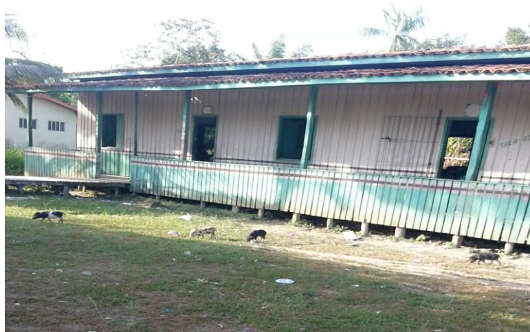
Figura 1 - Fachada da escola onde se realizou a pesquisa