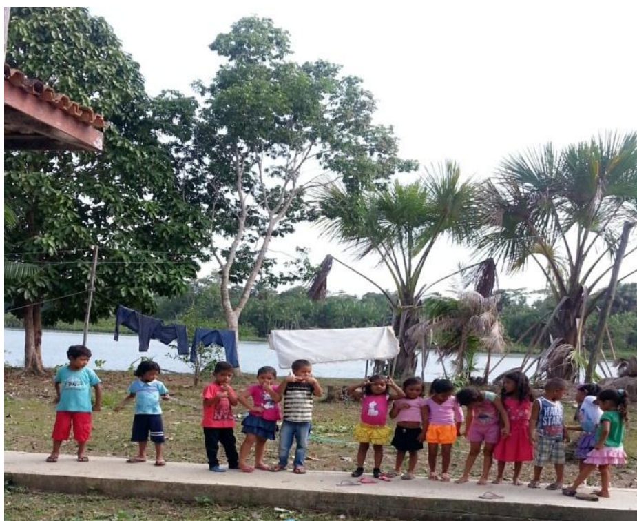
Figura 17- Medida da altura da árvore utilizando crianças dispostas lado a lado

A análise da ideia 2 de colocar as crianças lado a lado em linha reta seguindo a calçada apresentou-se favorável. Assim, a forma de dispor as crianças com as das extremidades segurando a ponta da fita e as outras preenchendo os espaços entre as duas extremidades pareceu ótima estratégia. Dessa maneira, foram utilizadas todas as crianças que estavam presentes. Entretanto, mesmo as crianças sendo dispostas uma ao lado da outra em distância considerada normal, elas chegaram à conclusão por estimativa de que era preciso mais crianças. No entanto, pode-se considerar que a tarefa foi cumprida devido à estratégia utilizada. A situação pode ser visualizada na Figura 17.