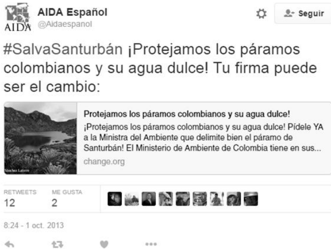
Figura 1. Tuit AIDA: Páramo de Santurbán

Asimismo, la Asociación Interamericana para la Defensa del Ambiente (AIDA, 2014) promovió dos campañas lanzadas el 1 de octubre de 2013, presentadas en el microblog Twitter (Aidaespanol, 2013), creando el hashtag #SalvaSanturbán, para proteger el Páramo de Santurbán. No obstante, el impacto de este tuit no tuvo suficiente trascendencia, interpretada desde la medición, ya que se generaron apenas 12 retuits y 2 me gusta (ver figura 1). Sin embargo, a partir del 1 de octubre de 2013 y hasta el 26 de mayo de 2016 los tuiteros, entre la sociedad civil y organizaciones no gubernamentales (ONG), publicaron 122 entradas con el hashtag en mención.