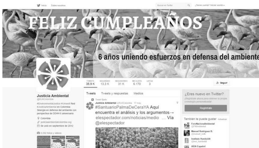
Figura 5. Cuenta de Twitter: @RJAColombia

Rodríguez Becerra (@manuel _ rodb), exministro de Medio Ambiente en Colombia, con más de 26.100, quien se destaca por ser figura política que debate en el escenario offline y online los impactos que el extractivismo genera; c) y finalmente el Foro Nacional Ambiental (@FNAmbiental) con más de 20.200 seguidores.