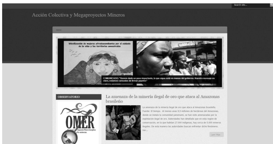
Figura 3. Blog: Acción Colectiva y Megaproyectos Mineros

investigación: Ciencia de la Información, Sociedad y Cultura; Conflicto, Región y Sociedades Rurales y el Observatorio de Territorios Étnicos, ambos de la Pontificia Universidad Javeriana, junto con organizaciones no gubernamentales como el Colectivo de Abogados José Alvear Restrepo, el Grupo Antorcha de la Universidad Nacional, la Asociación de Cabildos de Sa'ath Tama Kiwe, la Asociación de Cabildos del Norte del Cauca (ACIN), representantes de la Organización Nacional Indígena de Colombia (ONIC), el Consejo Regional Indígena del Cauca, entre otros, a organizar un evento que se llamaría: «Encuentro de Acción Colectiva y Megaproyectos Mineros», desde el cual se cambiaría esta lógica asimétrica, y por ello, el lugar principal de enunciación sería ocupado por los pueblos, las organizaciones y la academia que nos ubicamos desde otras perspectivas.