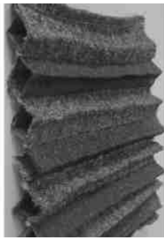
图2 形状记忆机织物

样。当形状记忆材料受温度感应激发时,这些褶皱的管闭合,因而织物收缩;而当温度返回时,织物则回复定型的形状。