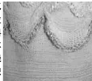
图3 形状记忆针织物

图3为一种形状记忆针织物。它利用了不同位置所采用的形状记忆材料受激发时响应速率的不同,因此这种织物有环绕人体移动的视觉效果。织物还可设计成双重颜色或质地。形状记忆效果被激发时引起结构打开,展现