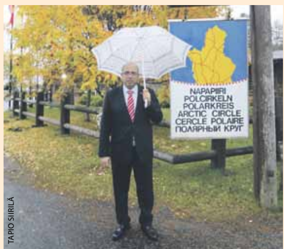
Suurlähettiläs Taissir Al Adjouri Napapiirillä.