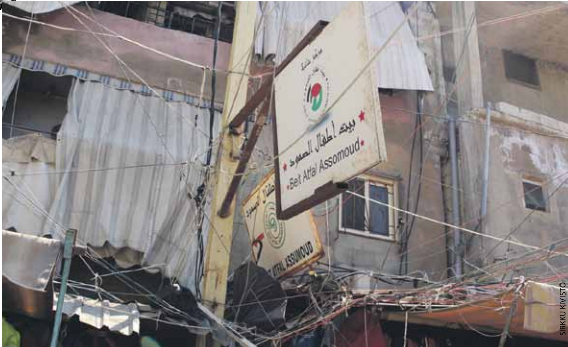
Beit Atfal Assomoudin Shatilan toimintakeskus sijaitsee leirin pääkujan varrella räjäjässä kerrostalossa, toisessa kerroksessa, Ohessa on BAS:in Shatilan toimintakeskukseen johtava kyltti, joka opastaa poikkeamaan paikalle talojen välistä. Kyltin asentamisessa oli varottava sähkötapaturmaa. Shatilassa 16 lapsella ja kahdella vanhuksella on suomalaiset kummit AKYSin kautta.