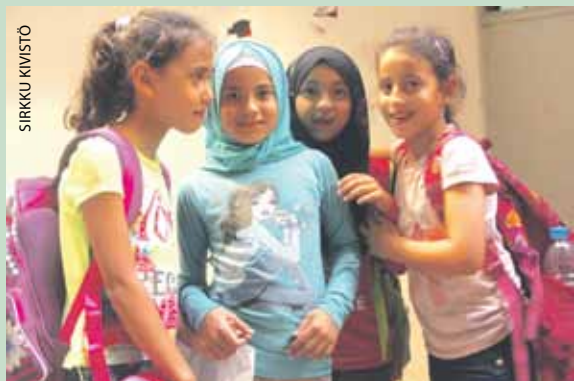
Shatilan läksykerholaisia poistumassa kerhosta.

Alkusyksystä kummivastaavamme Sirkku Kivistö vieraili Libanonissa, jossa juhlittiin yhteistyökumppanimme Beit Atfal Assomoudin (Sisukkaiden lasten talo) 40-vuotista toimintaa. Lähes yhtiä kauan, 36 vuotta, on jatkunut kummilapsiyhteistyömme. Tällä vuosituhannella tuki on laajentunut myös päiväkotilapsiin ja vanhuksiin. Lisäksi