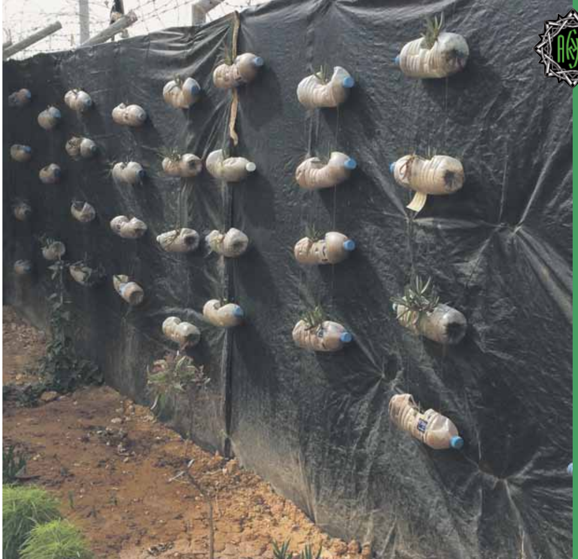
Yrttiviljelmää Zaatarin verkoaitaan virvoitusjuomapulloista tehdyssä kasvitarhassa.

Kysyin eräältä ystävältäni, kuvittelenko vain vai onko huivin käyttö lisääntynyt, johon hän vastasi, että huivitonta naista pidetään nykyään automaattisesti kristittyinä.