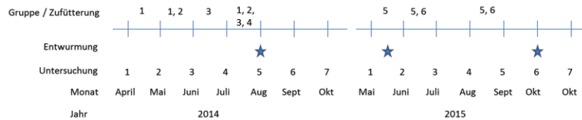
Abbildung 1: Gruppen mit Untersuchungen und Zufütterungsabschnitten

Cinnamomum zeylanicum , Allium sativum , Artemisia vulgaris ) in einer Dosierung von 20 g pro 100 kg Körpergewicht täglich für 10 Tage, die mit der Silage während der Zufütterungsperioden verfüttert wurde (Abb. 1). Die Kontrollgruppe bekam während dieser Periode nur die Silage zugefüttert. Bei den monatlichen Untersuchungen (U) wurden die Tiere gewogen, Kotproben genommen und mittels McMaster Methode mit einer unteren Nachweisgrenze von 40 Eiern auf Eiausscheidung (EpG) untersucht, sowie die Augenschleimhäute mittels FAMACHA Methode beurteilt. 2014 erfolgte im August eine Entwurmung von Tieren ab einem FAMACHA-Wert von 3. 2015 erfolgte eine Entwurmung aller Kitz zwischen 1. und 2. Untersuchung. Die Entwurmung bei der U 6 erfolgte ab einem FAMACHA-Wert von 3. Die statistische Auswertung erfolgte mit dem Statistikprogramm SAS 9.1.4 mithilfe der SAS Prozedur Mixed und den fixen Effekten Gruppe (K, V) und Untersuchung (1-7). Die Ergebnisse sind als Least Square Means (LS-Means), und p-Werte dargestellt.