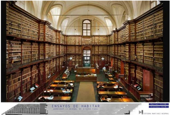
Estudiar / Leer / Investigar