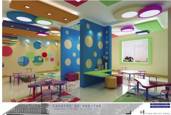
Aprender / Educar / Jugar