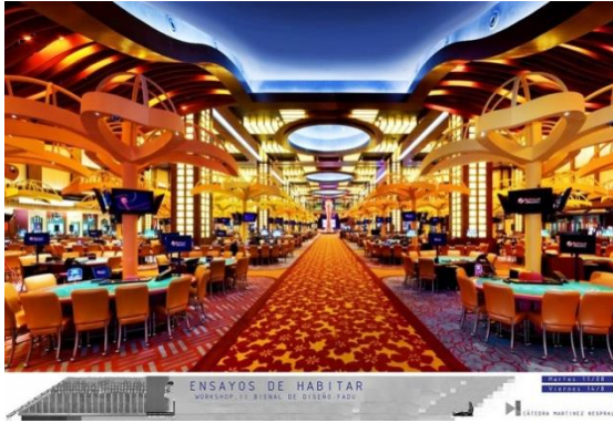
Jugar / Apostar