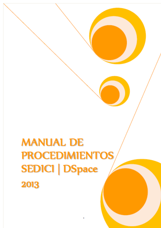
Figura 6. Tapa del manual. Nótese el detalle del número de página sobreimpreso en el margen inferior de la hoja

Para la tapa o portada se utilizó una de las ofrecidas por el propio Word (denominada «Moderno»), a la que sólo se le cambiaron los colores que venían por defecto (se pasó de la gama de los azules a la de los naranjas) (ver FIGURA 6).