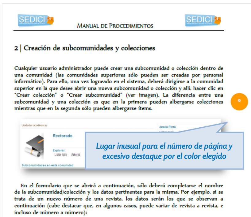
Figura 4. Detalle del número de página

todas las páginas y llama excesivamente la atención, en tanto no se lo identifica a golpe de vista con el número de página por su posición y color inusual.