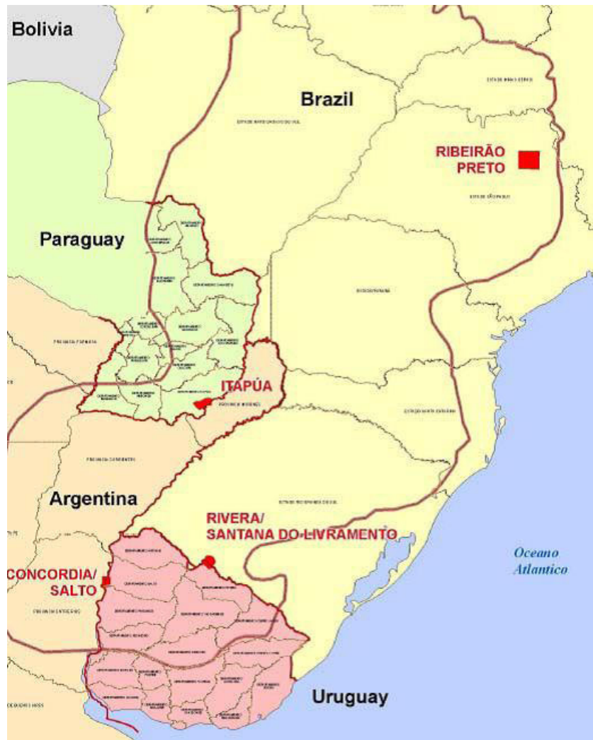
Figura 1. Delimitación del área del Sistema Acuífero Guaraní y ubicación de los Pilotos.