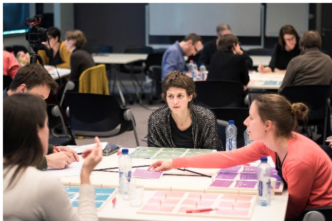
Figuur 1 Leertraject voor Ruimte Vlaanderen