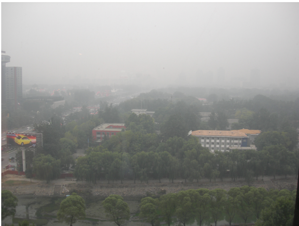
Fotos fra Beijing i 2006. Det øverste viser en situation med klar himmel, og det nederste en situation, hvor luftforureningen er stigende som følge af svage vinde.