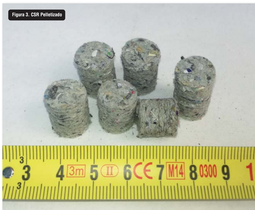
Figura 3. CSR Pelletizado

sido llevada a cabo por el Comité Europeo de Estandarización mediante el paquete de normas elaboradas por el comité técnico CEN/TC 343 - Solid Recovered Fuels. Estas normas establecen, por un lado, los métodos a seguir para la determinación de diferentes parámetros que permiten caracterizar los CSR. Por otro, definen aquellos parámetros que son importantes para la calidad de los mismos. En este sentido, la norma CET/TS 15359 (2012): “Combustibles sólidos recuperados: especificaciones y clases”, propone un sistema de clasificación de la calidad de los CSR basado en los valores límite de tres parámetros: el poder calorífico inferior (PCI), como parámetro económico; el contenido en cloro, como parámetro técnico, y el contenido en mercurio, como parámetro medioambiental.