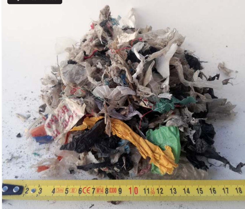
Figura 2: CSR triturado

Los rechazos poseen un contenido energético elevado debido a su alto porcentaje en papel/cartón, plástico y madera (Di Lonardo et al. 2012), especialmente cuando los RD de entrada a la planta tienen un alto poder calorífico (Bessi et al. 2016), por lo que pueden