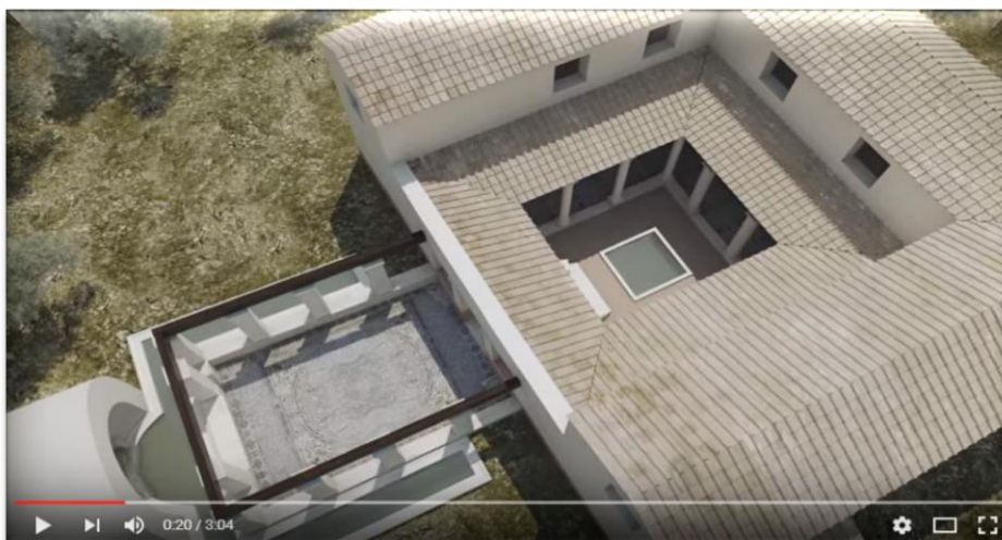
Fotograma de la reconstrucción de la villa de Salar, vista aérea.

https://www.youtube.com/watch?v=_MjoaTsI-9c