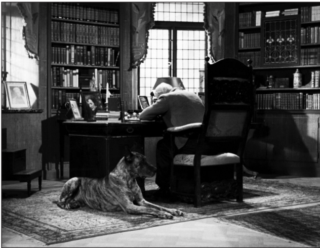
Figura 1: fotograma de Fresas Salvajes