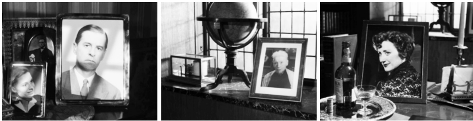
Figuras 2, 3 y 4: fotogramas de Fresas Salvajes

Fuente: BERGMAN, Ingmar. Smultronstället , 1957.