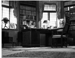
Figura 13: fotograma de Fresas Salvajes

Fuente: BERGMAN, Ingmar. Smultronstället , 1957.