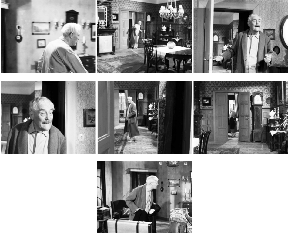
Figuras 14, 15, 16, 17, 18, 19 y 20: fotogramas de Fresas Salvajes

Fuente: BERGMAN, Ingmar. Smultronstället , 1957.