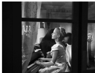
Figura 12: fotograma de Fresas Salvajes

Fuente: BERGMAN, Ingmar. Smultronstället , 1957.