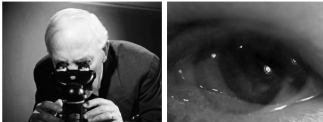
Figuras 23 y 24: fotogramas de Fresas Salvajes

Fuente: BERGMAN, Ingmar. Smultronstället , 1957.