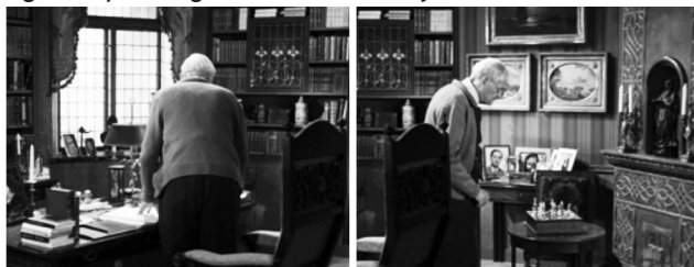
Figuras 5 y 6: fotogramas de Fresas Salvajes

Fuente: BERGMAN, Ingmar. Smultronstället , 1957.