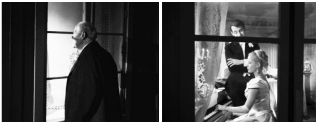
Figuras 10 y 11: fotogramas de Fresas Salvajes