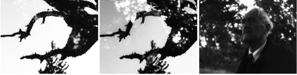
Figuras 7, 8 y 9: fotogramas de Fresas Salvajes

Fuente: BERGMAN, Ingmar. Smultronstället , 1957.