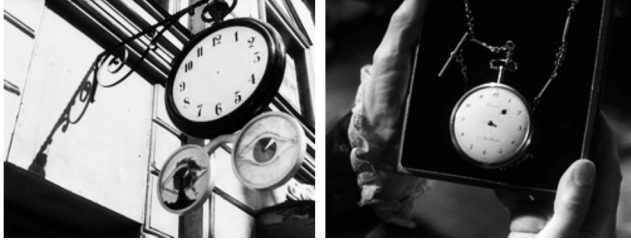
Figuras 21 y 22: fotogramas de Fresas Salvajes

Fuente: BERGMAN, Ingmar. Smultronstället , 1957.