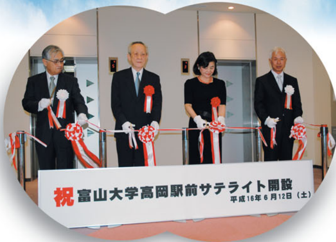
●富山大学高岡駅前サテライト オープニングセレモニー (6月12日)