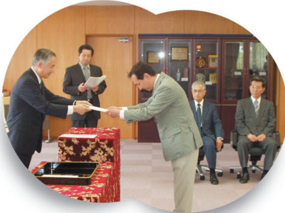
●富山第一銀行奨学財団研究助成金贈呈式 (6月10日)