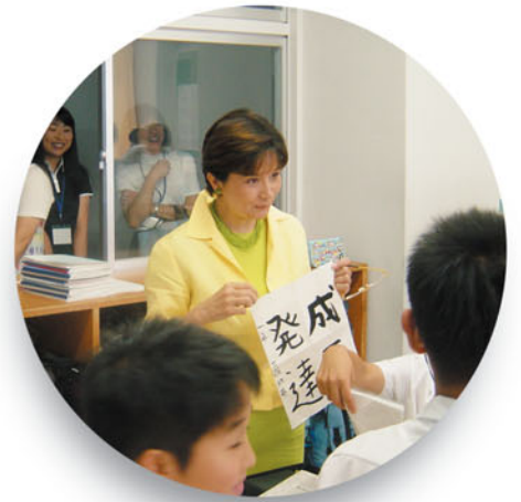
●附属中学校「オープン・スクール・デイ」(6月29日)