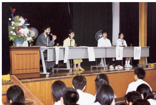
活発に意見交換するパネラー