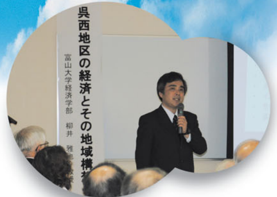
●高岡駅前サテライト 第1回公開講座 「呉西地区の経済とその地域構想」(6月12日)