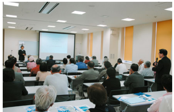
第1回公開講座の風景