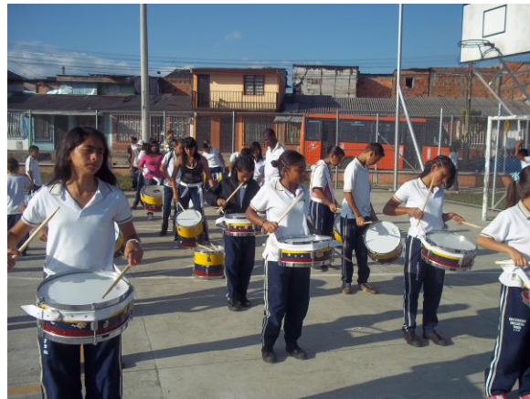
Fotografía 3 y 4. Ensayo en aula de clase y ensamble general.