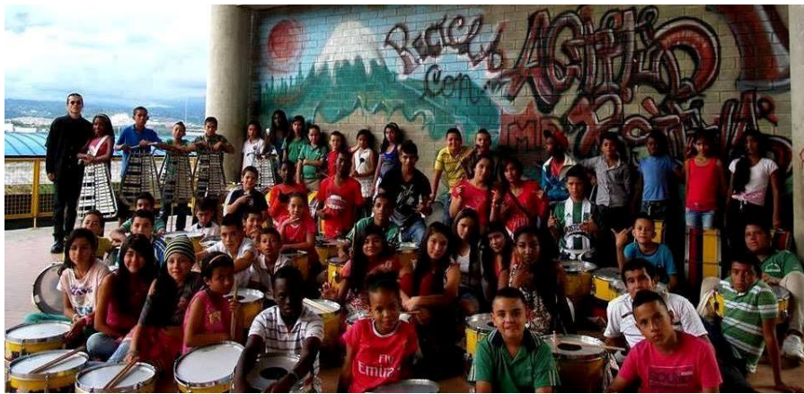
Fotografía 2. Ensayo general.

El diseño y aplicación de esta unidad didáctica permitió que se desarrollara un trabajo serio y consecuente con lo planteado. Los temas y las estrategias establecidas en esta unidad permitieron dar continuidad a un proceso de aprendizaje musical y teniendo como resultado la banda en la institución.