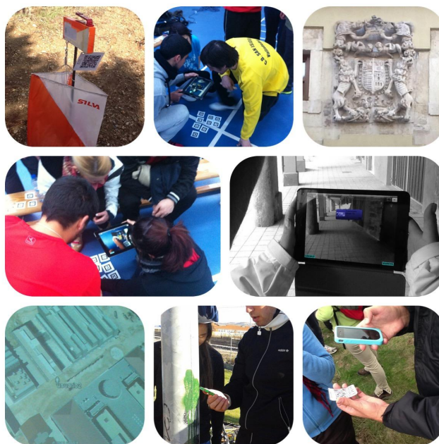
Figura 4. Imágenes del proceso en la Universidad.

Dentro del bloque el campamento educativo , el alumnado tuvo tareas asignadas, tales como coordinación de transportes, materiales, manutención, pernocta, pagos, actividades didácticas transversales, ambientales y de animación etc.. El desarrollo de actividades se realizó durante dos días en el medio natural, donde llevaron a cabo actividades de orientación, piragüismo, senderismo, y otras de apoyo a los contenidos dados. Algunos de los propósitos de estas actividades fueron posibilitar el conocimiento, disfrute y valoración del Parque Natural de la Montaña Palentina, para la permanencia y práctica de diversas actividades físicas en el medio natural, así como utilizar y valorar las TIC para el aprendizaje de recursos didácticos y animaciones de dichas actividades.