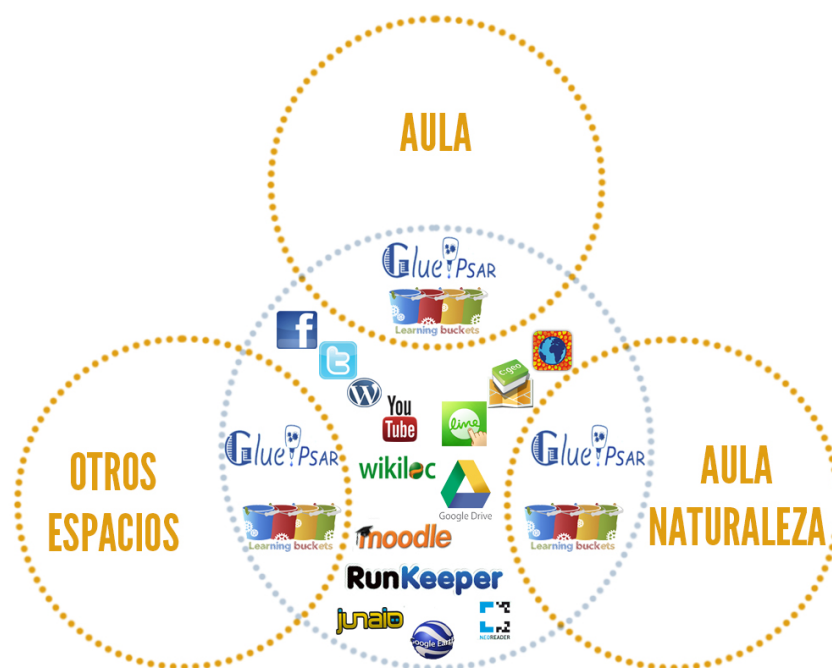
Figura 2. Espacios y herramientas tecnológicas utilizadas.

Siguiendo una metodología de aprendizaje basado en proyectos, la asignatura se dividió en cuatro bloques temáticos: (A) orientación en el medio natural, (B) desplazamiento y permanencia en el medio natural, (C) campamento educativo y (D) senderos escolares. Así, dentro de cada uno de los bloques temáticos, se desarrollaron actividades con implementación tecnológica, favoreciendo el proceso formativo del alumnado. En la Figura 3, mostramos un resumen de las actividades llevadas a cabo, profundizando a continuación en los distintos bloques de contenidos de la asignatura.