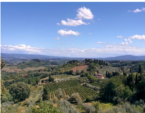
Fig. 2: Vista del paesaggio del Montepaldi Long Term Experiment (MoLTE). Gli elementi ecologici contribuiscono alla bellezza del paesaggio e influenzano la biodiversità del campo sperimentale.

Questo contribuisce ulteriormente a creare un ambiente favorevole per supportare e aumentare la presenza di insetti benefici, con una conseguente migrazione nel campo sperimentale. Ad ogni modo, tale similarità tra campioni indica un’azione positiva dei predatori nel corso di tutto il periodo di campionamento, anche negli spot più lontani dai margini, e nel campo convenzionale.