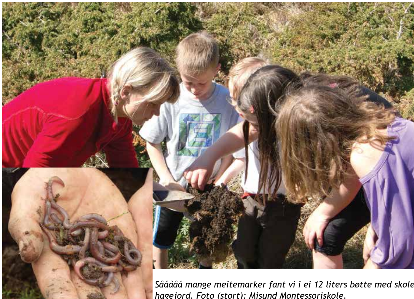
Såååå mange meitemarker fant vi i ei 12 liters bøtte med skolehagejord.