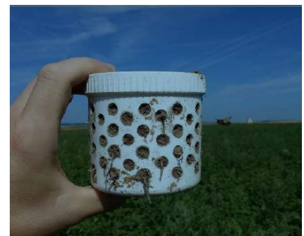
Abb. 1: Schematische Darstellungen einer Topf- und einer Tellerfalle sowie Abbildung einer Meles-Topffalle.