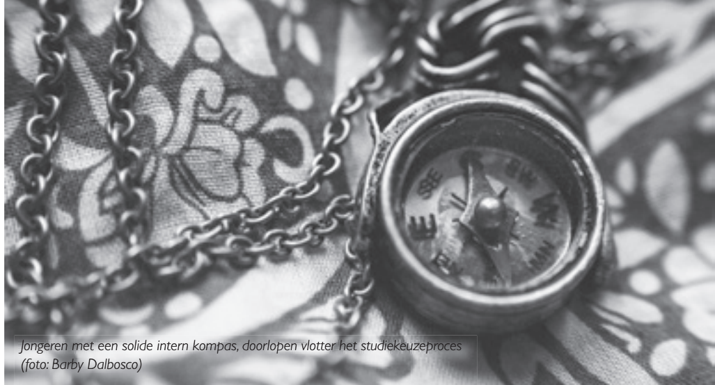
Jongeren met een solide intern kompas, doorlopen vlotter het studiekeuzeproces

We werkten met vier samenvattende scores voor de studiekeuzetaken: oriëntatie, exploratie (een samengestelde score van exploratie van zichzelf en exploratie in de diepte en de breedte), informatie (een samengestelde score van informatie over zichzelf en informatie in de diepte en de breedte), en binding (een samengestelde score van binding met een keuze en beslissingsstatus). 1 Aan de hand van regressieanalyses voorspelden we elke studiekeuzetaak op basis van de scores op autonome motivatie, gecontroleerde motivatie en amotivatie. We controleerden hierbij voor geslachtsverschillen en voor de richting waarin leerlingen zich in de eerste graad bevonden (A-stroom of B-stroom). 2