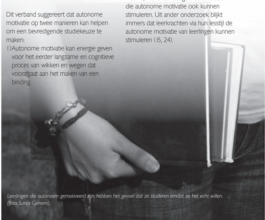
Leerlingen die autonoom gemotiveerd zijn, hebben het gevoel dat ze studeren omdat ze het echt willen.

Zoals ons onderzoek toont is de kwaliteit van studiemotivatie, als uiting van een intern kompas op schools vlak, belangrijk om leerlingen een bevredigende studiekeuze te laten maken. Dit is hoopgevend nieuws, want keuzebegeleiders zouden die autonome motivatie ook kunnen stimuleren. Uit ander onderzoek blijkt immers dat leerkrachten via hun lesstijl de autonome motivatie van leerlingen kunnen stimuleren (15, 24).