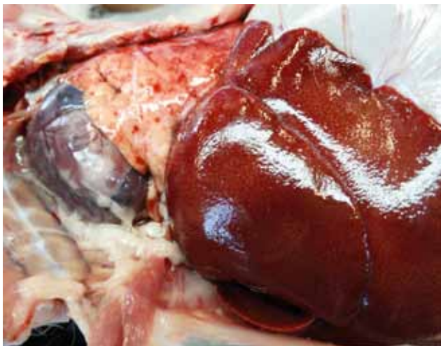
Figuur 1. Macroscopisch autopsiebeeld van rabbit hemorrhagic disease. De long vertoont enkele bloedingen en de lever heeft een bleek aspect. Bij manipulatie is de lever ook broos. In combinatie met een anamnese van plotsse sterfte en het cytologisch beeld kan een sterk vermoeden worden geuit van RHD als oorzaak van de sterfte. De bevestiging gebeurt via histologisch onderzoek en PCR om de virusvariant te bepalen.

Deze kunnen gecontamineerd worden door excreties van geïnfecteerde (wilde) konijnen, maar ook indirect via gecontamineerde materialen en wilde dieren en huisdieren die het virus verslepen. In 1998 beschreven Asgari et al. het belang van vliegen als mechanische vectoren van het virus: één enkele “flyspot” (anale en/of orale secreties van een vlieg die zich gevoed had op een geïnfecteerde lever) was in staat om via orale weg een konijn te infecteren met RHDV. Ook via de conjunctiva zouden vliegen het konijn kunnen besmetten. Stekende insecten die bloed gezogen hebben bij een viremisch konijn, zouden het virus ook rechtstreeks parenteraal bij een ander konijn kunnen inoculeren. Een overzicht van reeds eerder uitgevoerde studies naar insectvectoren staat in het artikel van Cooke en Fenner (2002). Ook via feces van andere aaseters die zich gevoed hebben met aangetaste karkassen, zou het virus overgedragen kunnen worden (Frölich et al., 1998; Cooke en Fenner, 2002). Het RHDV is zeer resistent en kan zeer lang overleven in de omgeving. In karkassen van gestorven konijnen blijft het virus bijvoorbeeld tot drie maanden infectieus (McColl et al., 2002). Het virus overleeft eveneens vriestemperaturen, waardoor de OIE (2015) zelfs suggereert dat diepgevroren vlees van geïnfecteerde konijnen verantwoordelijk kan zijn voor spreading van het virus naar nieuwe regio's of continenten.