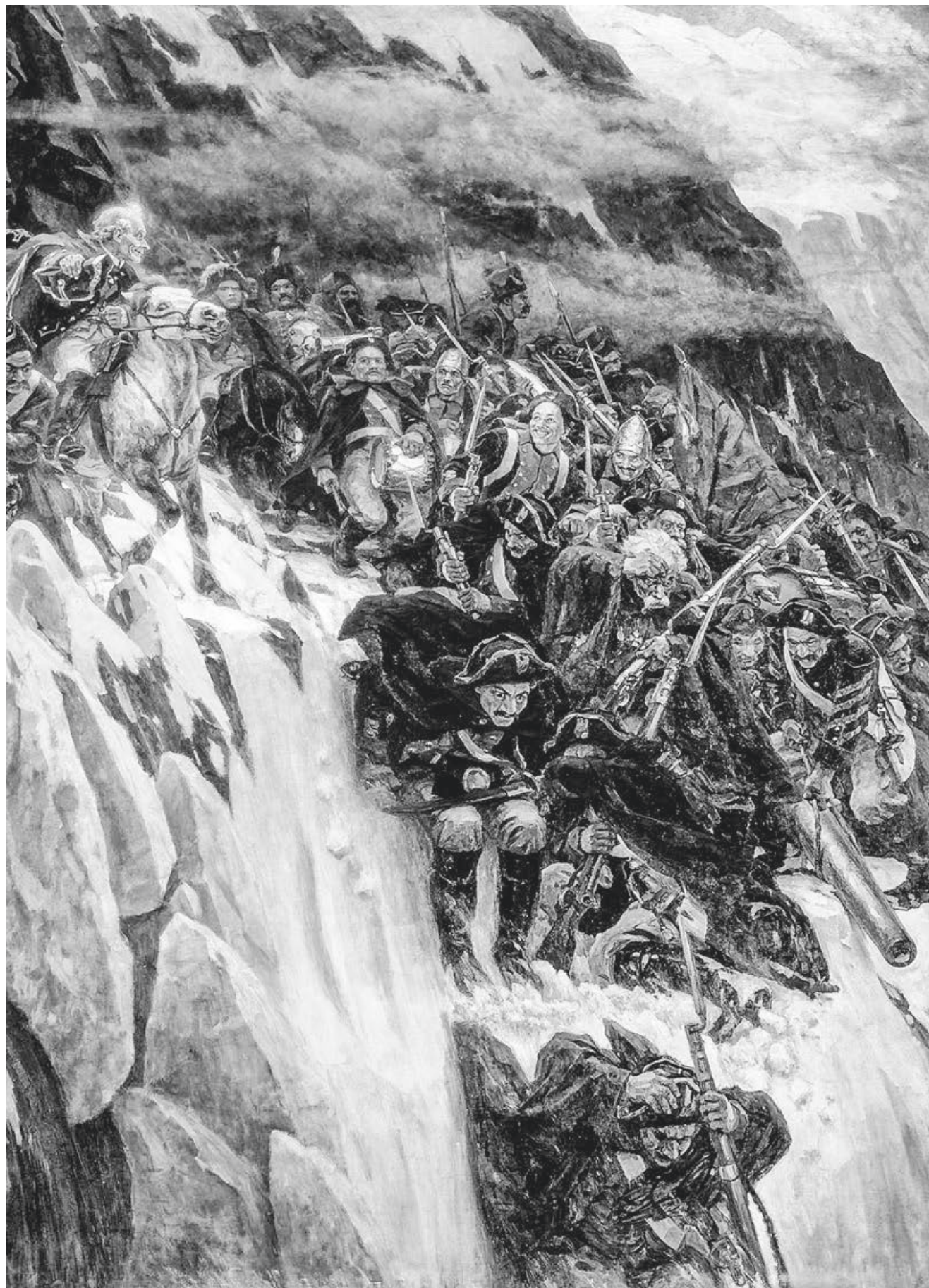
8 Vasilij Ivanovič Surikov: «Suvorovs Überquerung der Alpen» (1899).