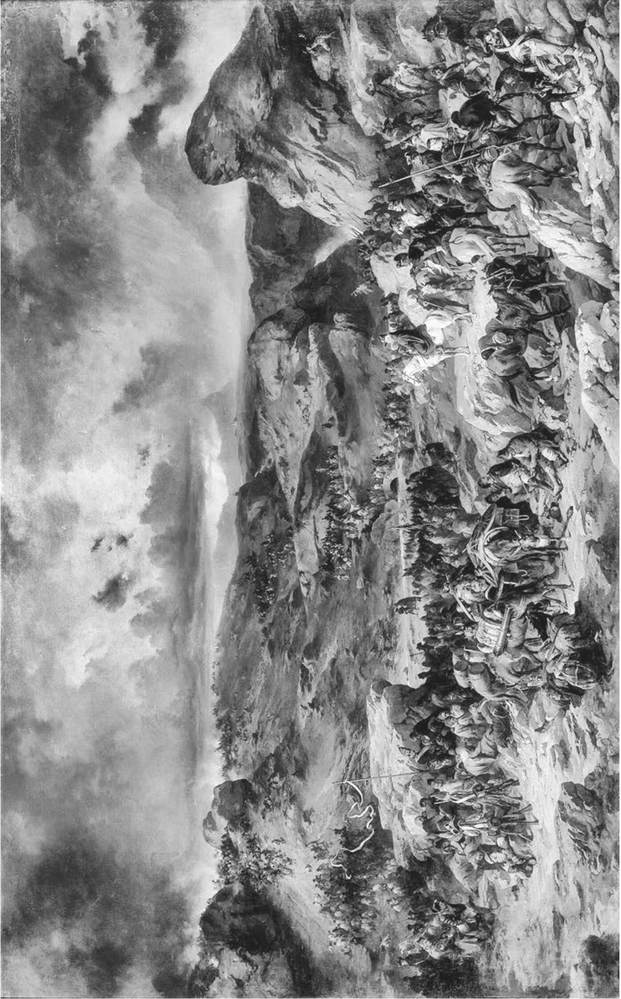
7 Alexander E. von Kotzebue: «Suvorovs Überquerung der Alpen» (1857/58).