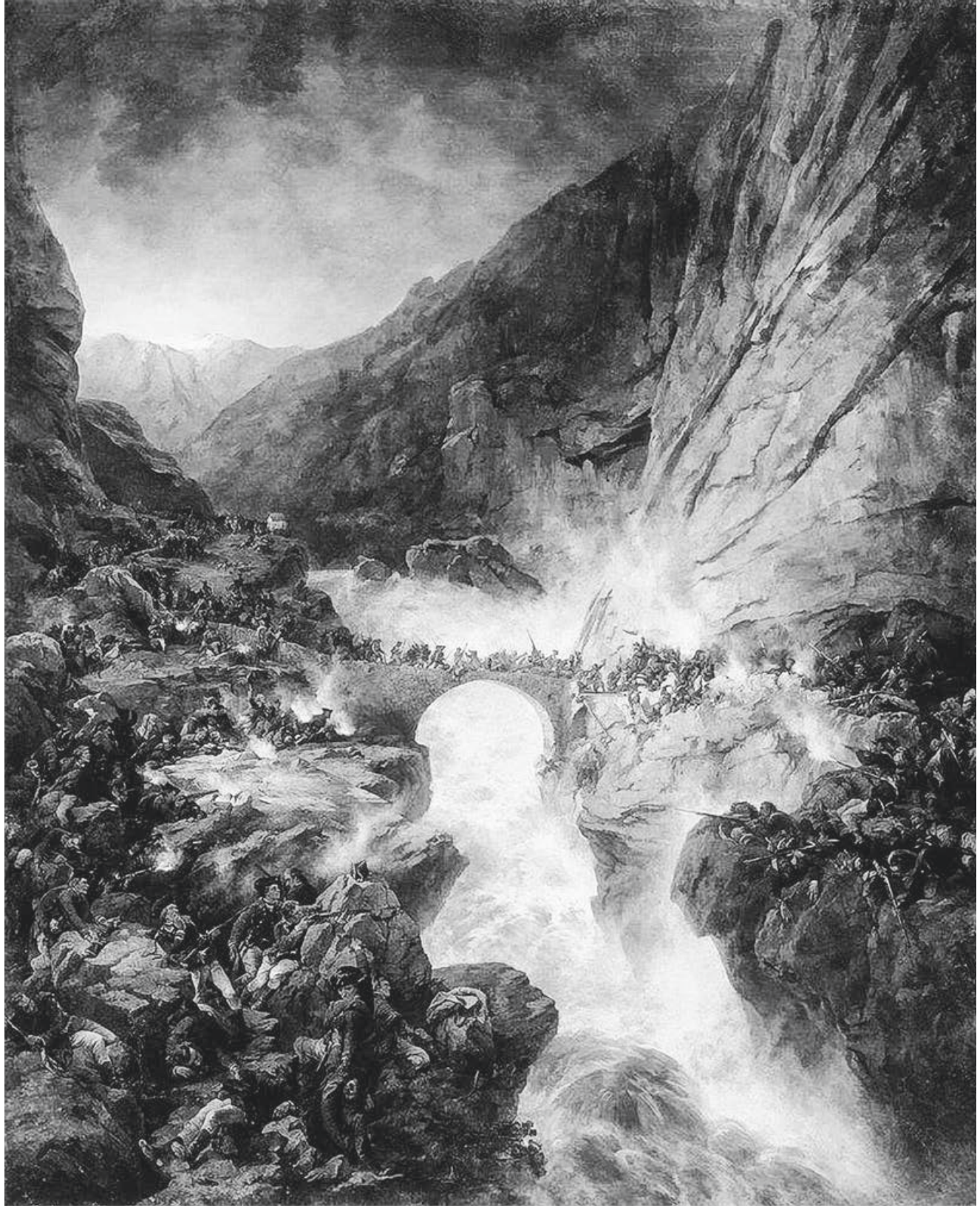
6 Alexander E. von Kotzebue: «Übergang über die Teufelsbrücke» (1857/58).