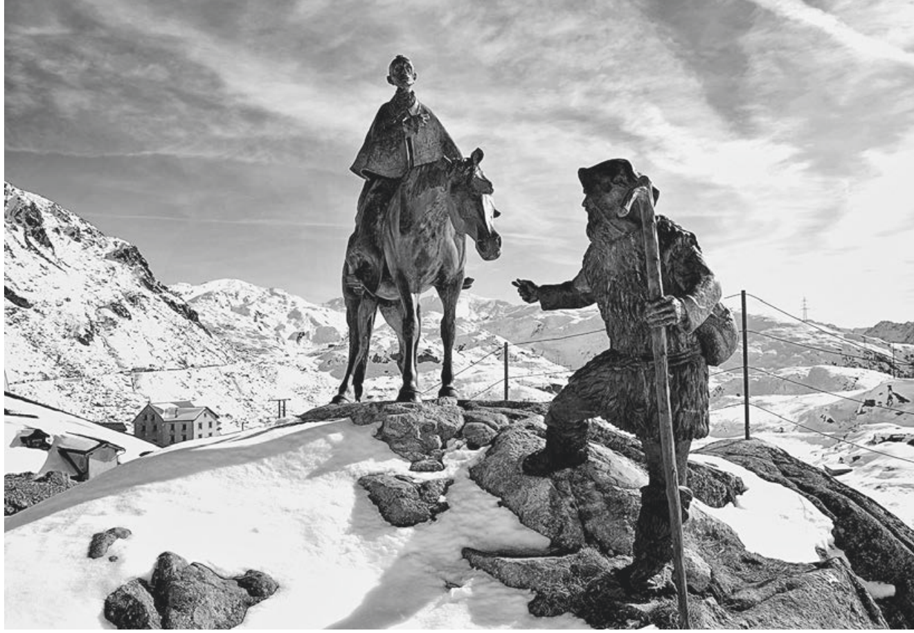
10, 11 Dimitrij Tugarinov: «Suvorov-Denkmal» (eingeweiht 1999).