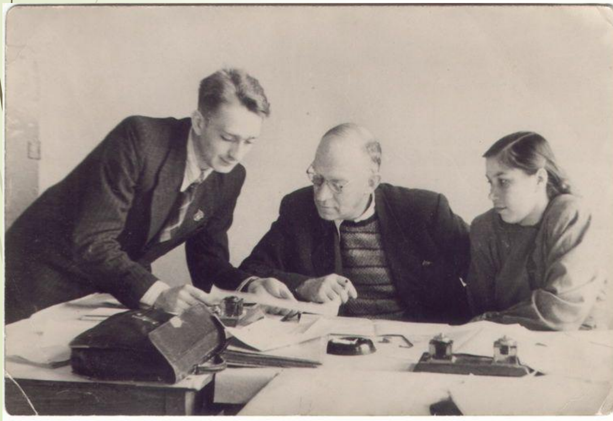
На кафедре экономики и организации машиностроительной промышленности – 1950г.

Создал научно-исследовательскую лабораторию экономики и планирования машиностроительного производства при Харьковском инженерно-экономическом институте.