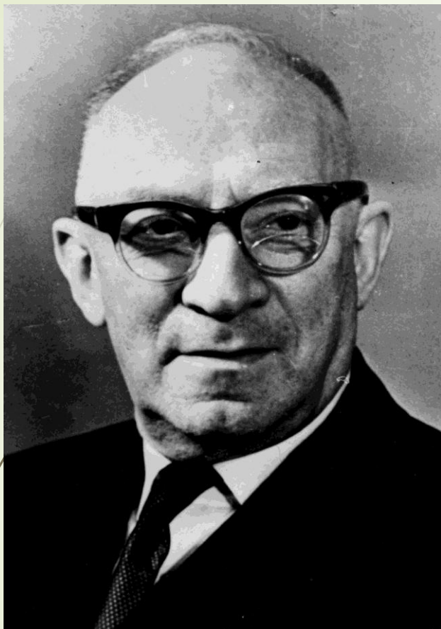
Евсей Григорьевич Либерман