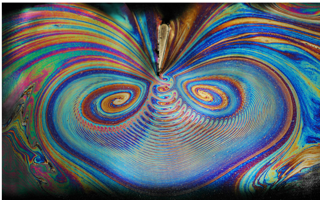
Figur 3. Viftestrøm frembragt af finnen i den vandrette sæbefilm [7]. Se også billedet på forsiden.