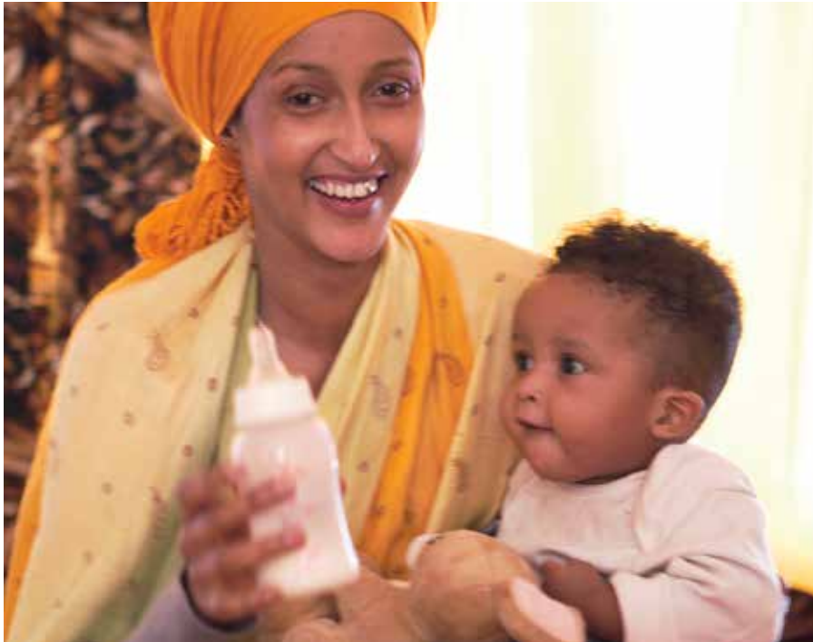
Overgangskosten suppleres her med modermælksersatning.

Det er en gængs opfattelse, at risstivelse i en mængde på 15 % af kulhydratet kan give større mæthedfølelse. Der foreligger ikke videnskabelig dokumentation for dette.