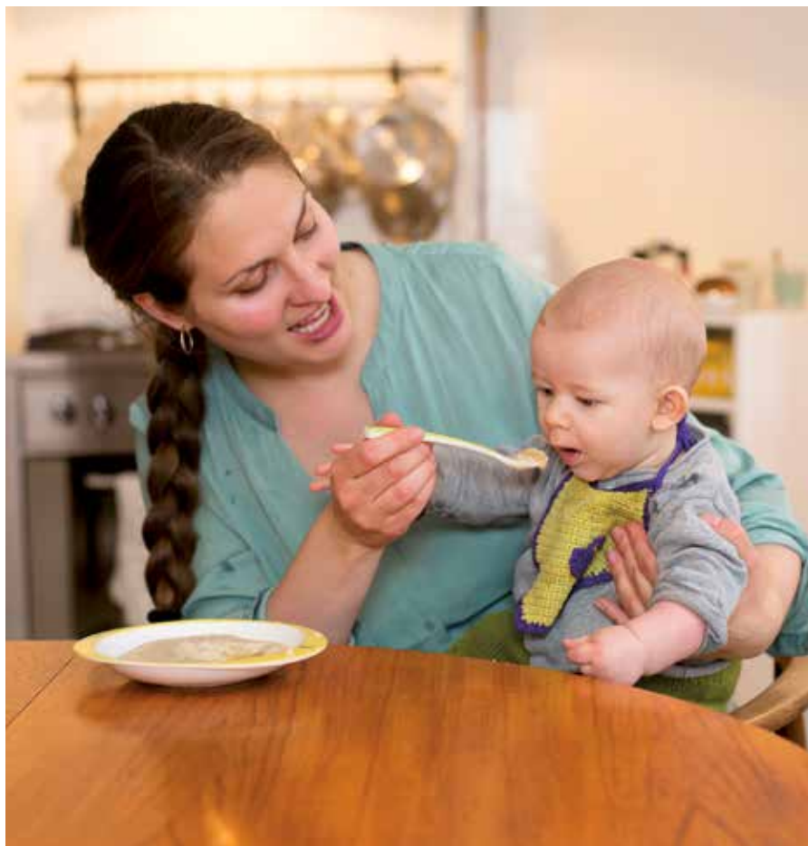
Hjemmelavet grød med lidt frugtmos er god at starte dagen på.

barn og fra måltid til måltid. Det kræver, at forældrene er opmærksomme, tålmodige og i stand til at aflæse spædbarnets signaler på om det fx er sultent, mæt, træt eller har brug for en pause som beskrevet i afsnit 2.1.1.