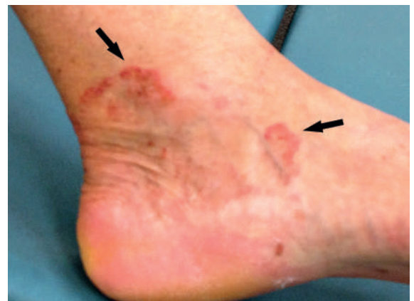
Abbildung 2: Tinea cutis am linken Fussgelenk im Rahmen des Hypercortisolismus (Immunsuppression).