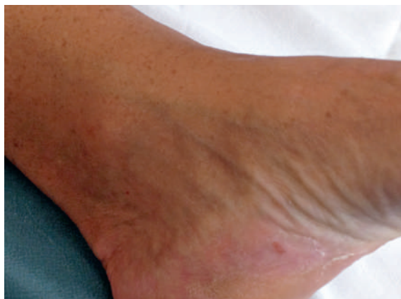
Abbildung 3: Linkes Fussgelenk: Regredienz des Exanths (nicht mehr sichtbar) nach der Therapie mit Ketoconazol.

monrezeptoren (z.B. GIP, LH, Vasopressin u.a.) [1, 2] oder eine lokale ACTH-Produktion vom Nebennierengewebe im Rahmen von genetischen Mutationen in Frage [3]. Vor einer möglichen chirurgischen Intervention wurde eine orale Therapie mit Ketoconazol begonnen. Unter dieser Therapie verschwand nach einigen Tagen das juckende Exanthem (Abb. 3) und im Verlaufe besserten sich Diabetes mellitus und sekundäre arterielle Hypertonie deutlich.