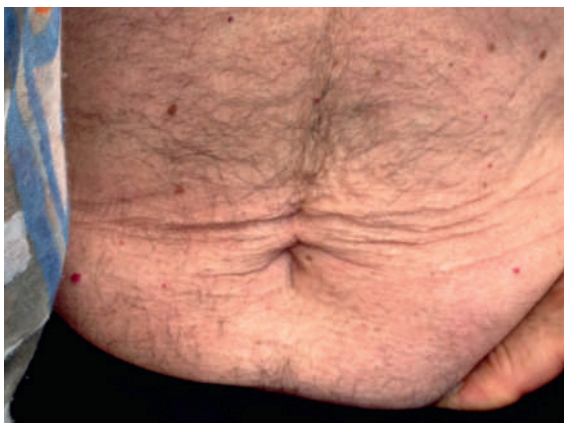
Abbildung 1: Abdomineller Hirsutismus vor Therapie mit Ketoconazol.