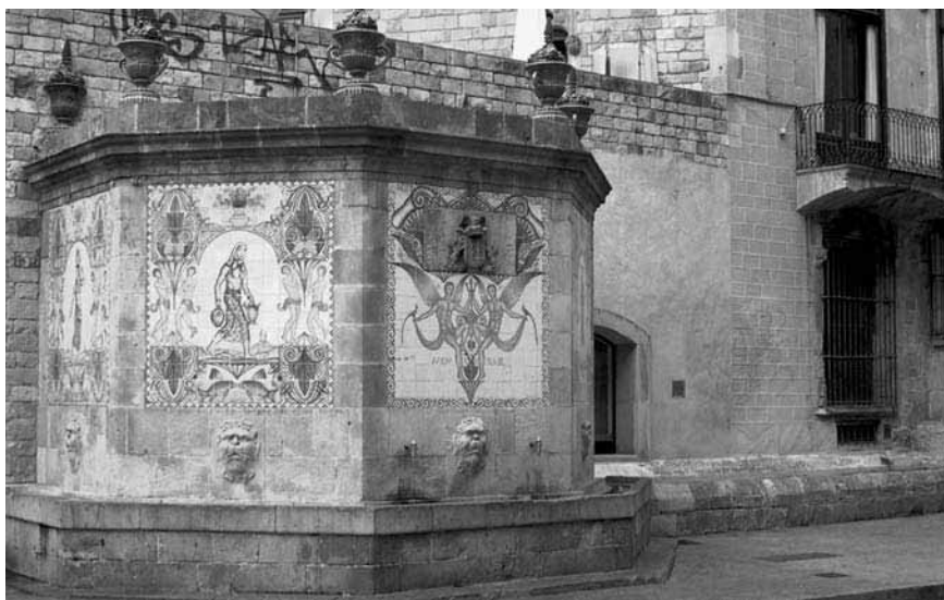
6. Font i abeurador de Santa Anna, 2005.

49 Manuel ANGELÓN, Guía satírica de Barcelona (1854). Bromazo topográfico-urbano-típico-burlesco , Barcelona, Ediciones Librería Millà, 1946, p. 35.