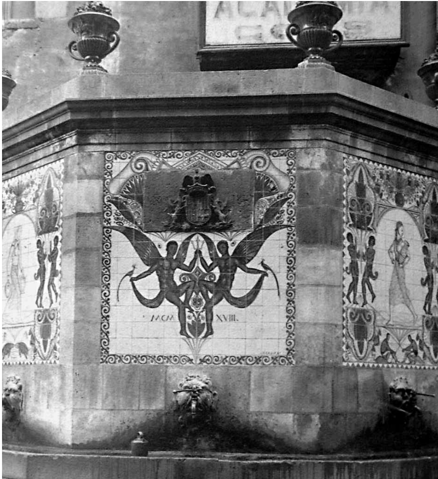
4. La font de Santa Anna, el 1918. Fotografia del Museu Josep Aragay de Breda.

torre octogonal. Aquesta forma poligonal es correspon simplement a unes importants reformes de la font que es van fer al segle XIX; la font i abeurador originals eren molt més senzills. En tot cas, una idea del seu aspecte potser ens la podríem fer establint paral·lelismes en observar les altres fonts que es van construir durant el mateix període a la ciutat, generalment simples estructures rectangulars, amb arcosoli o sense, com les de Sant Just i Pastor, la de la riera de Sant Joan o la de Santa Maria del Mar. 25