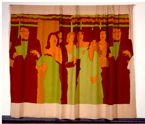
Ilustración 6 Beatriz González. Comedia . 1981. de la serie. Decoración de interiores 37

rigida a no desatinar del concierto de las complacencias con el magnate foráneo, con ellos se firma y se brinda (como en la obra-cortina de Beatriz González 35 ), y en las portadas de los medios se tapan las solapadas arremetidas contra los derechos humanos de la población manifestados estructuralmente en el estado de abandono institucional de los ramos de la economía 36 que hicieran prosperar a ese ciudadano por siempre expectante —y por siempre vencido, defraudado por el Estado— de su papel en el nuevo escenario que como por entre rendijas se le aparece en el horizonte a través del arte entre las brumas y oscuridades del ámbito político colombiano.