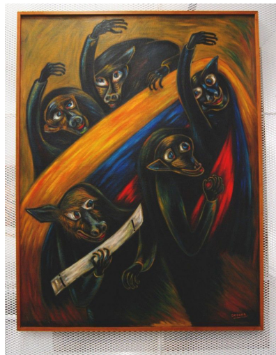
Ilustración 7. “Junta Militar” Débora Arango 1957.