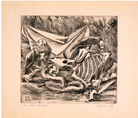
Ilustración 2. La Res-pública , Carlos Correa 13 .

en ambos como la limpia osamenta de la vaca que ha sido hasta los huesos carcomida por una estirpe de pajarra-cos sin manos para crear, ni ojos de gran apertura para los conceptos, pero con grandes y puntiagudos picos con los que destruir y devorar torpemente, a su alrededor el lagarto rastreador y trepador como el negroide descrito por Fernando González, y el muy humanizado búho que deja entrever al corrompido jurisconsulto frente al cual la carnicería sobre la Res-Pública acontece como si nada 12 .