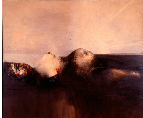
Ilustración 4. Violencia , Alejandro Obregón, 1962. 19

La disposición social de comprensión, recepción y aceptación de tal actitud abierta y creadora —con lo que se podría asociar la ideología de la modernidad— no es homogénea y tales posiciones oscilan en intervalos que pueden llegar a ser antípodas: son Sociedades Abiertas y Sociedades Cerradas 20 según la descripción que propuso (Raimundo Popper).