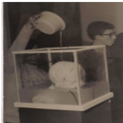
Ilustración 5. Cabeza de Lleras , Antonio Caro. 29

Lo anterior tan solo para mostrar dos casos de la más necesaria y causal actualidad del drama, que se ha repetido a través de todo nuestro relato nacional entre las posiciones más humanitarias y profundas asociadas a los objetivos de la sociedad abierta (y los sujetos que han encarnado esa posición: los artistas e intelectuales), y la pesada carga del tradicionalismo comprometido con las instituciones premodernas que son las fuerzas contraculturales que en países como Colombia, han logrado ser quienes dictan las formas culturales o “personalidad histórica”, como lo llamo el historiador Jaime Jaramillo Uribe, de lo que hemos llegado a ser y de nuestras expectativas latentes como comunidad.