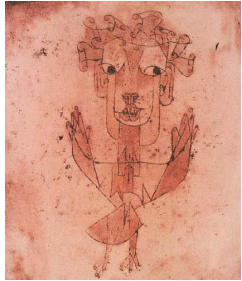
Ilustración 1. Angelus Novus Paul Klee. Museo de Israel (Jerusalén) 1920. 6

“Articular históricamente lo pasado no significa conocerlo «tal y como verdaderamente ha sido». Significa adueñarse de un recuerdo tal y como relumbra en el instante de un peligro.” 7