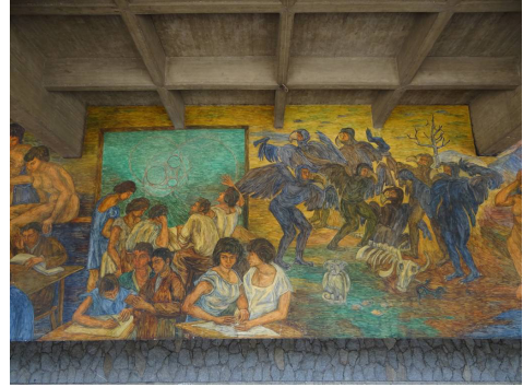
Ilustración 3. Mural Biblioteca Central UdeA

La nuestra es sin duda una época que reclama un mayor nivel de participación de la mirada, en tanto ésta remite a un sujeto activo de la vida cultural y política, y por tanto el poder de convocación del sentido y del goce estético se encuentra más libre, y es mayor y más claro el espectro que comparten quienes bajo solo la alusión de la idea o el concepto reconstruyen la particularidad del sentido o “aura 14 ” que trasmite la obra.