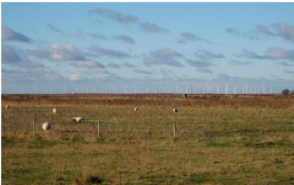
Bild 3. Lillgrund vindkraftpark, vy från Gessie villastad, Vellinge kommun.

Havsbaserad vindkraft kan vara ett sätt att undvika att vindkraften kommer i konflikt med närboendes upplevelse av intrång. I vårt intervjumaterial framgår att denna fördel urholkats genom närheten till kusten.