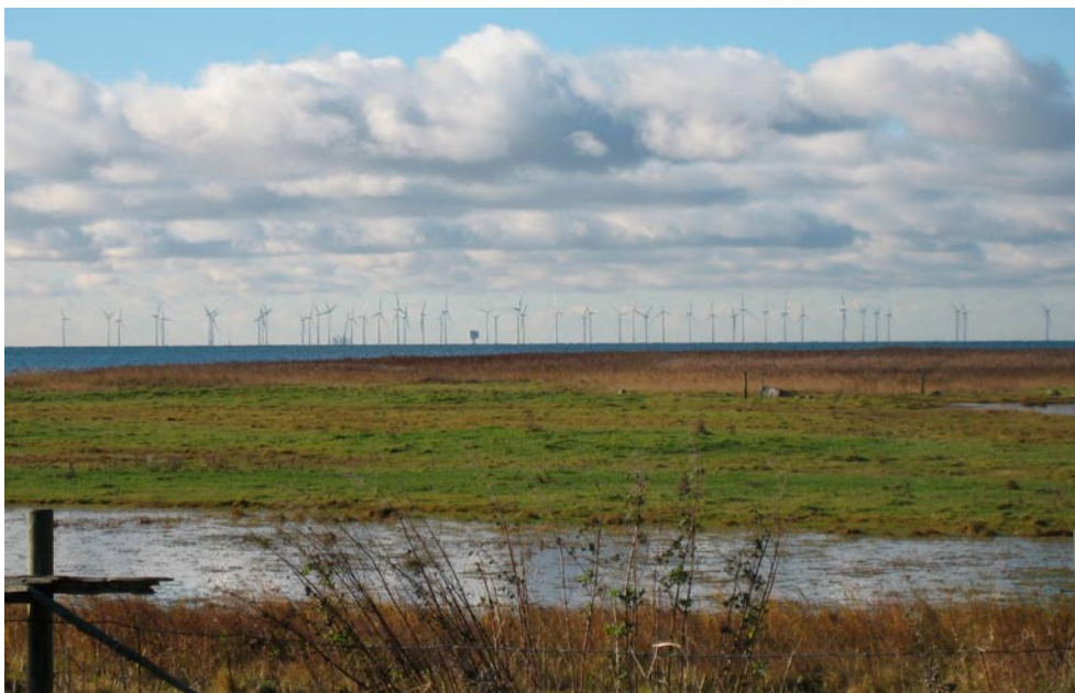
Bild 2. Lillgrund vindkraftpark, vy från Bunkeflostrand, Malmö.

Att bygga 48 stycken vindkraftverk på det sättet och förstöra en hel kustlinje. Och det är ju naturskyddat här, det är alltså strandskydd och strandviltsskydd och jag vet inte allt vad vi har. Vi får inte göra ett dugg, vi får inte bygga en korvkiosk där. Det tror jag inte att man kunde föreställa sig. Det fanns inte i min föreställningsvärld.